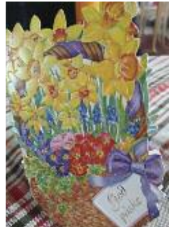
-og dette dobbelkortet fra 2003