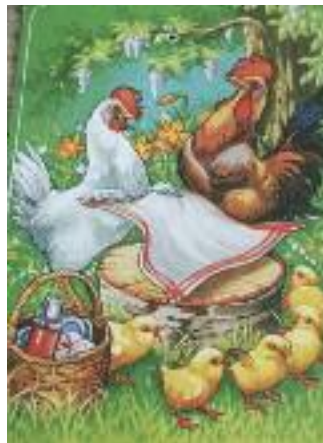
Dette kortet er fra 1994