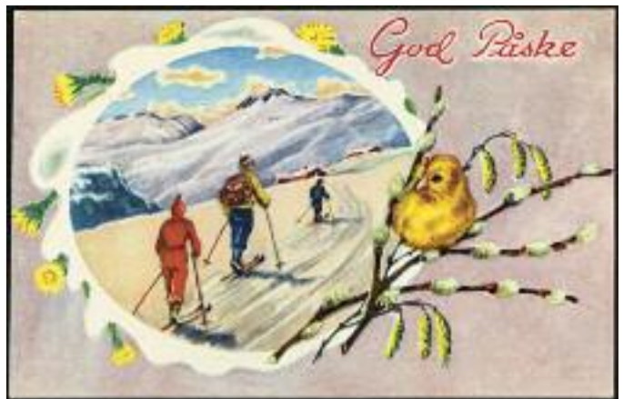
Kort hentet fra Nasjonalbibliotekets samling. Ca. 30-40-tallet

Her er noen eksempler på forskjellige kort fra tidligere tider.