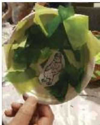
Sakkeus i tréet

Programmet for kvelden er pedagogisk gjennomtenkt, og barna får stimulering innenfor mange områder, sånn som grov- og finmotorikk, språkstimulering, sansestimulering, og kognitivt. Det brukes en del tegn til tale uansett som det er barn som har behov for det eller ikke da dette er med på å fremme alle barns språkutvikling.