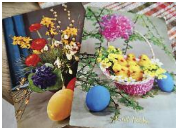
Kortet til venstre er fra 1965. Frimerket kostet 40 øre og er stemplet med Halden 300 år Jubileumsutstilling. Kortet til høyre er fra 1975.