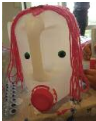
Plast blir til noe fint