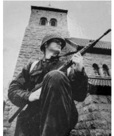
Dette er bildet som FB slo opp i sin omtale av «HV-slaget ved Kråkerøy kirke» på slutten av 1980-tallet. Men den bevæpnede «soldaten» som figurerer utenfor kirken, er identisk med journalisten som skrev artikkelen.