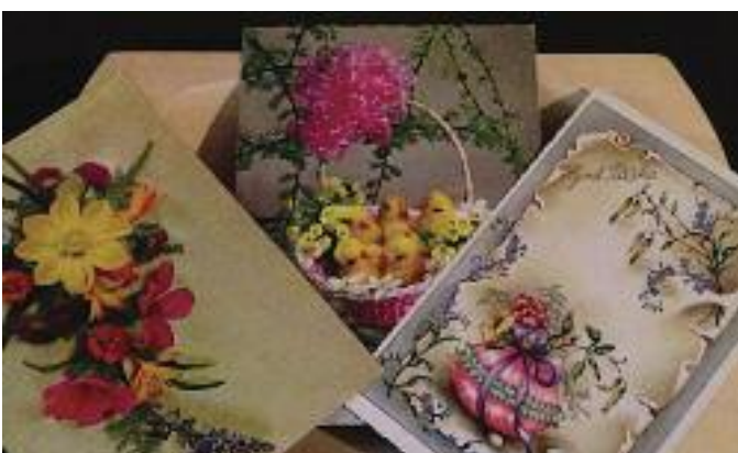
Kort fra 1950-tallet