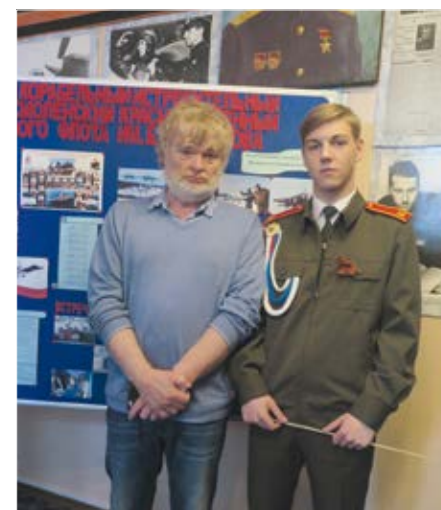
På besøk på en skole inne i en militærforlegning i Monchegorsk. Elevene var barn av de ansatte på forlegningen

Det som ble sagt, var en god blanding av skjemt og alvor krydret med litt allsang og resitasjon av dikt. En stor del av den voksne befolkningen i Monchegorsk snakker ikke engelsk, men når viljen til kommunikasjon er til stede, finnes det løsninger. En av de norske deltakerne fikk den ide å skrive det han ville si på mobilen sin. Via internett ble teksten oversatt til russisk. Det ble svært vellykket. Da han kom hjem, lå det en e-post og ventet på ham fra hans nye russiske venn.