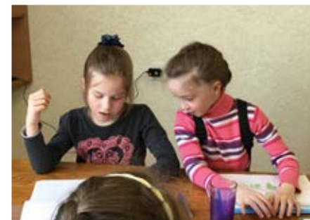
På søndagsskole i Monchegorsk