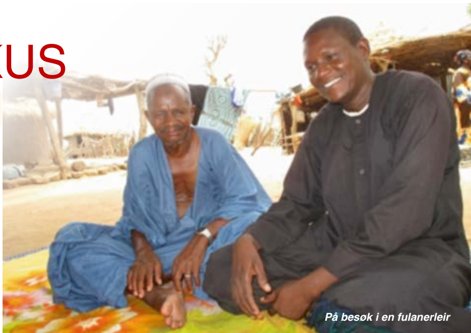
På besøk i en fulanerleir

Det er nå valgt ny regjering, men den er svak og lar seg lett friste til korrupsjon. På overflaten virker det rolig i landet, men av og til slår ekstremistene til med både kidnapping og drap. En del av Normisjonens misjonærer er reist tilbake til Mali, men de må tegne krigsforsikring før de drar. Det sendes ikke ut familier med barn. NMS/ Frikirken har et misjonærpar i hovedstaden, men det er for utrygt å reise tilbake til det opprinnelige arbeidsfeltet i øst-Mali.