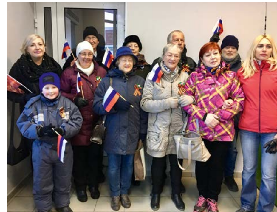
Russiske og norske venner klar til feiring av 9.mai.