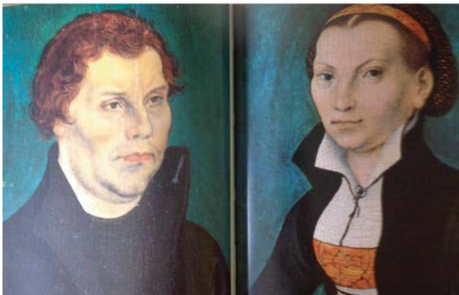
Martin og Katharina Luther

Allerede natten til påskesøndag i 1523 flyktet 12 nonner fra Cistercienserklosteret Marienthron ved Grimma. Skjult under presen-