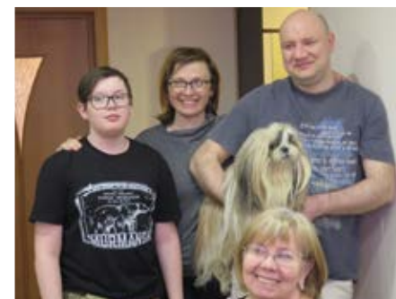
Hos denne hyggelige familien fikk vi servert middag søndag kveld