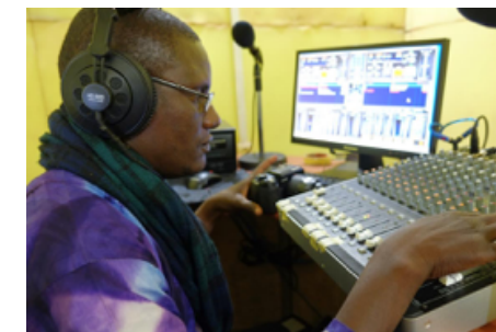
Adama produserer radioprogrammer