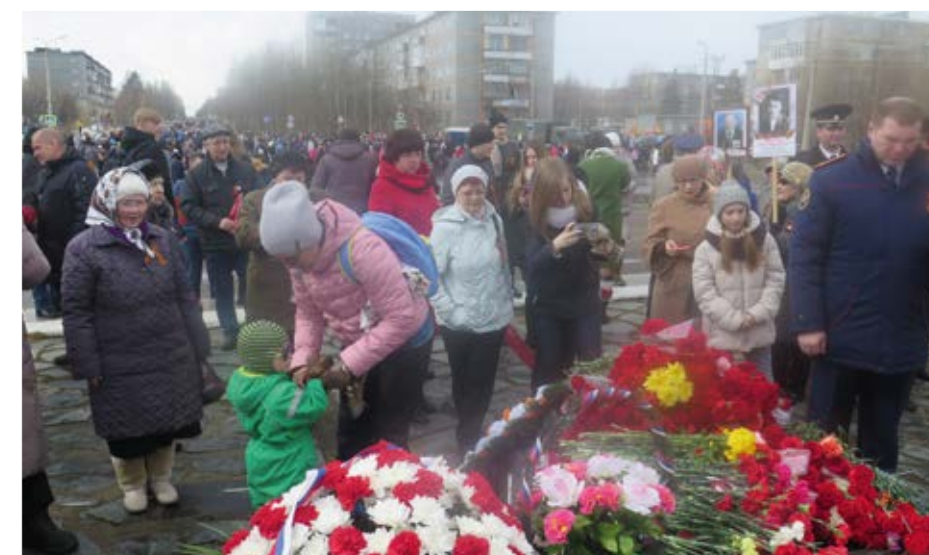
Kranser og blomster ble lagt ned på monumentet over de falne under andre verdenskrig