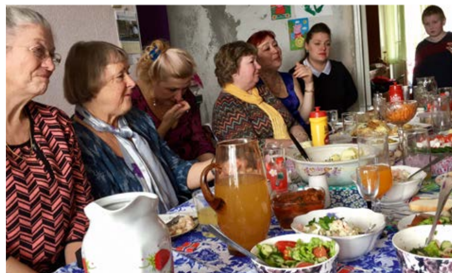
Feiring av Seiersdagen. Etter minnemarkeringen vil russerne samle sine nære og kjære rundt seg til et langt og godt måltid.

Men det som gjorde det sterkeste inntrykket, var de mange møter med mennesker i Monchegorsk. Samtaler med barn som viste at barn i Russland er nokså like barn i Norge. Lange samtaler rundt et middagsbord, hvor det var helt tydelig at vertskapet hadde gjort sitt ytterste for at gjestene skulle ha det bra. Midt på bordet hadde de gjerne pyntet med norske flagg.