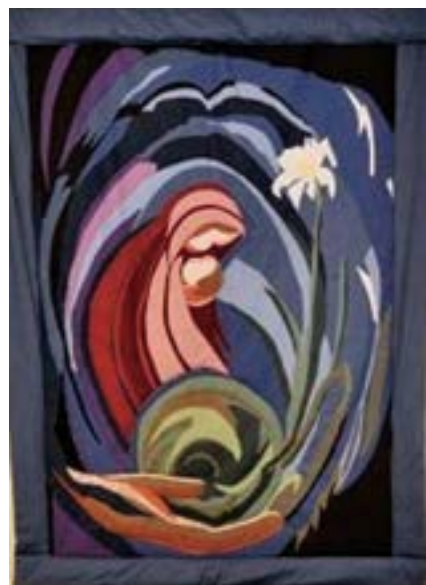
Maria og Jesusbarnet.

Gud lar vismennene fra en annen kultur, med et annet språk og annen religion bli ledet av en stjerne til Jesu føderom. Jesus ble ikke bare