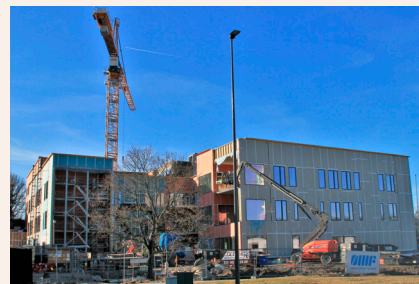
Bygging av nye Onsøyheimen.

Frøydis Romarheim på mail frorom@fredrikstad.kirken.no eller telefon 479 09 478