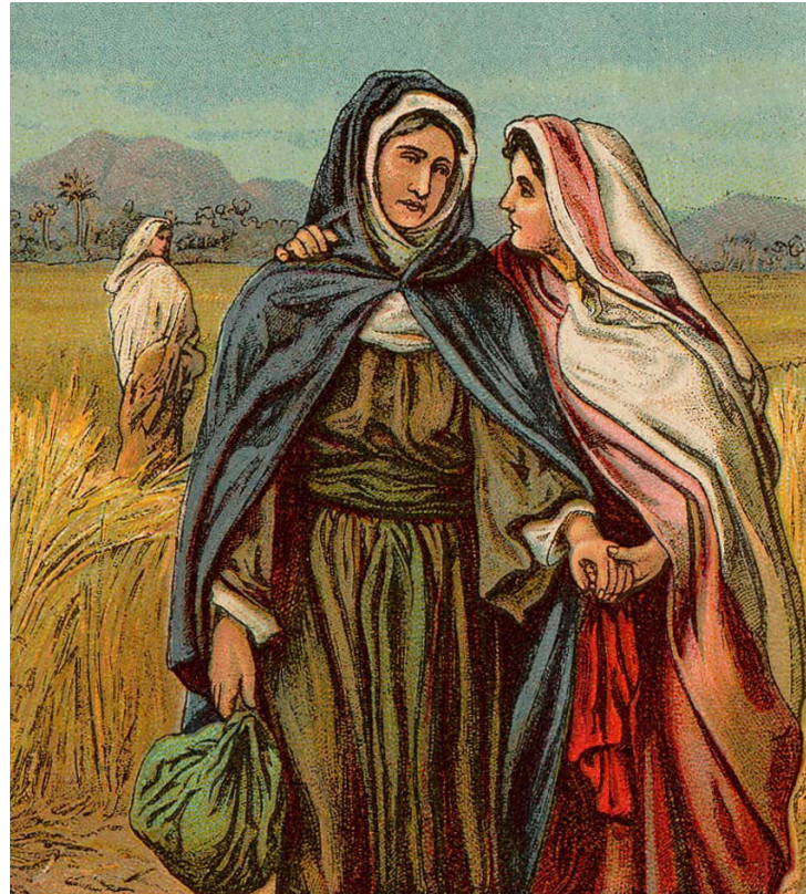
Noomi og Rut (amerikansk bildekort fra 1907,).

Da hungersnøden i Juda var over, bestemte Naomi seg for å reise tilbake til Betlehem. Hun regnet med at svigerdøtrene ønsket å bli i hjemlandet sitt, Moab, og finne seg nye moabittiske ektemenn. Rut ønsket imidlertid å reise sammen med Naomi og tjene Israels Gud. Hør hennes sterke utsagn: «Du skal ikke overtale meg til å skille lag med deg og dra hjem igjen. For dit du går, vil jeg gå, og der du bor, vil jeg bo. Ditt folk er mitt folk, og din Gud er min Gud. Der du dør, vil jeg dø, og der vil jeg begraves. Måtte Herren la det gå meg ille både nå og siden om noe annet enn døden skiller meg fra deg!» For en svigerdatter!