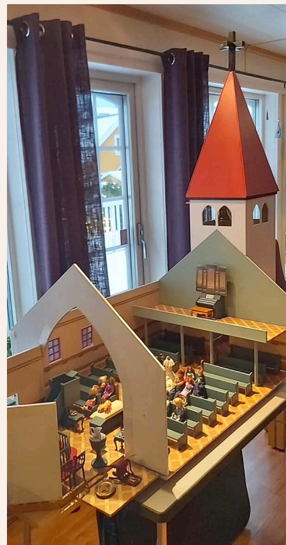
Miniatyrkirken er stor og måler L134xB60xH126 cm.

Miniatyrkirken er et veldig godt pedagogisk verktøy der barna blir kjent med kirkebygget gjennom lek. Barna er med og setter på plass alt av utstyr og møbler som fins i kirkerommet. De lærer navnet på de ulike tingene, får høre litt om hva som skjer i kirken og får testet kirkeklokkene i tårnet. Når kirken besøker