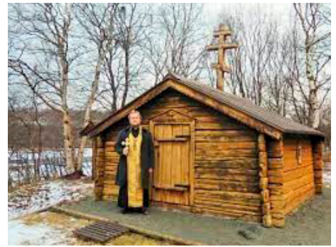
Kapellet i Neiden.

kapellets ene side, og et tradisjonelt gravmonument i tømmer er reist på dets andre side, av Kirkeforeningen i 1996. Rundt gravplassen er det et pinnegjerde. Nedenfor brer skoltejordet seg med noen få gamle hus, restene av skoltebyen.