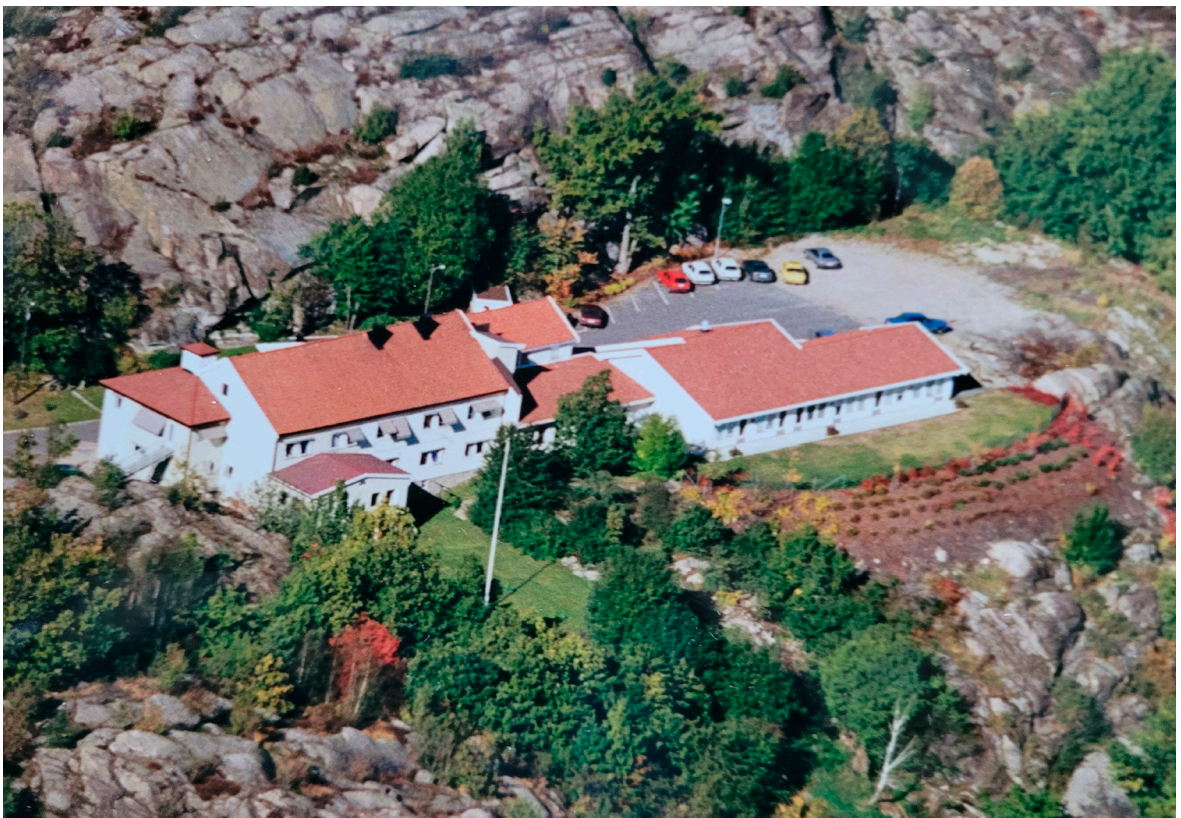
Slik mange husker Gressvik Alders- og sykehjem.

Da aldershjemmet ble solgt til Fredrikstad kommune i år 2000, ble salgssummen plassert i fond. Foreningens navn ble endret til Gressvik Venneforening for eldre.