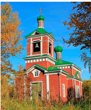
Dagens kirke i Boris Gleb.

Gjennom hele sitt liv bygde den hellige Trifon kirker. Således reiste han i 1565 en kirke for de hellige lidelsesbærere Boris og Gleb ved Pasvikelvens vestre bredd, ca. 40 km. fra klosteret. Det var en enkel tømmerbygning bestående av tre deler. Den ble skoltesamenes viktigste kirke og stod helt til 1944, da den brant ned.