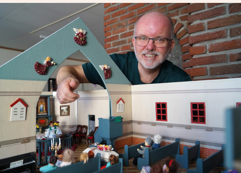
Stolt byggmester. Ingen tilfeldigheter her. Til og med tallene på salmetavla er gjennomtenkt og knyttet til både dåp, begravelse, bryllup osv. (Den gamle salmeboken).

Steinar forteller at den første idéspiren kom på en studietur til Stockholm der de besøkte en menighet som brukte en liten miniatyrkirke i møte med barn. En tid før Reform-97 kom, og 6-åringene skulle begynne på skolen, tok noen lærere ganske uformelt kontakt med kateketen og lurte på om de kunne få mer besøk. Dette gav spiren til å begynne å utvikle en plan for samarbeid. Læreplanen sa noe