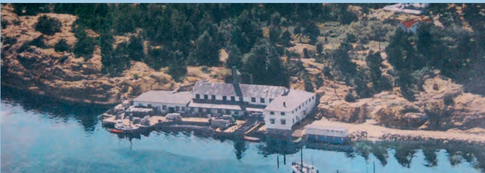
Over: Bjelland-bygget Til venstre og under: Engelsviken canning