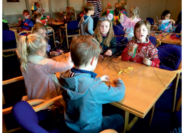
«Etter skoletid»-barn i aktivitet.

Så må vi ikke glemme julemiddagen, noen uker før jul blir foreldre og søsken invitert til flott julemiddag. Da er det helt fullt på bedehuset Frivillige lager middag, og barna dekker og pynter bordene. De har også øvd inn julesanger som de framfører. De er kjempeflinke, hadde unnet dere alle å høre dem.