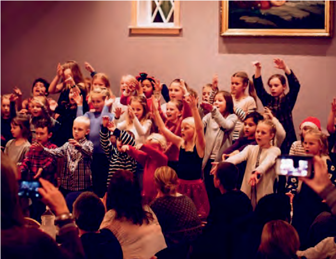
Sang på julemiddagen