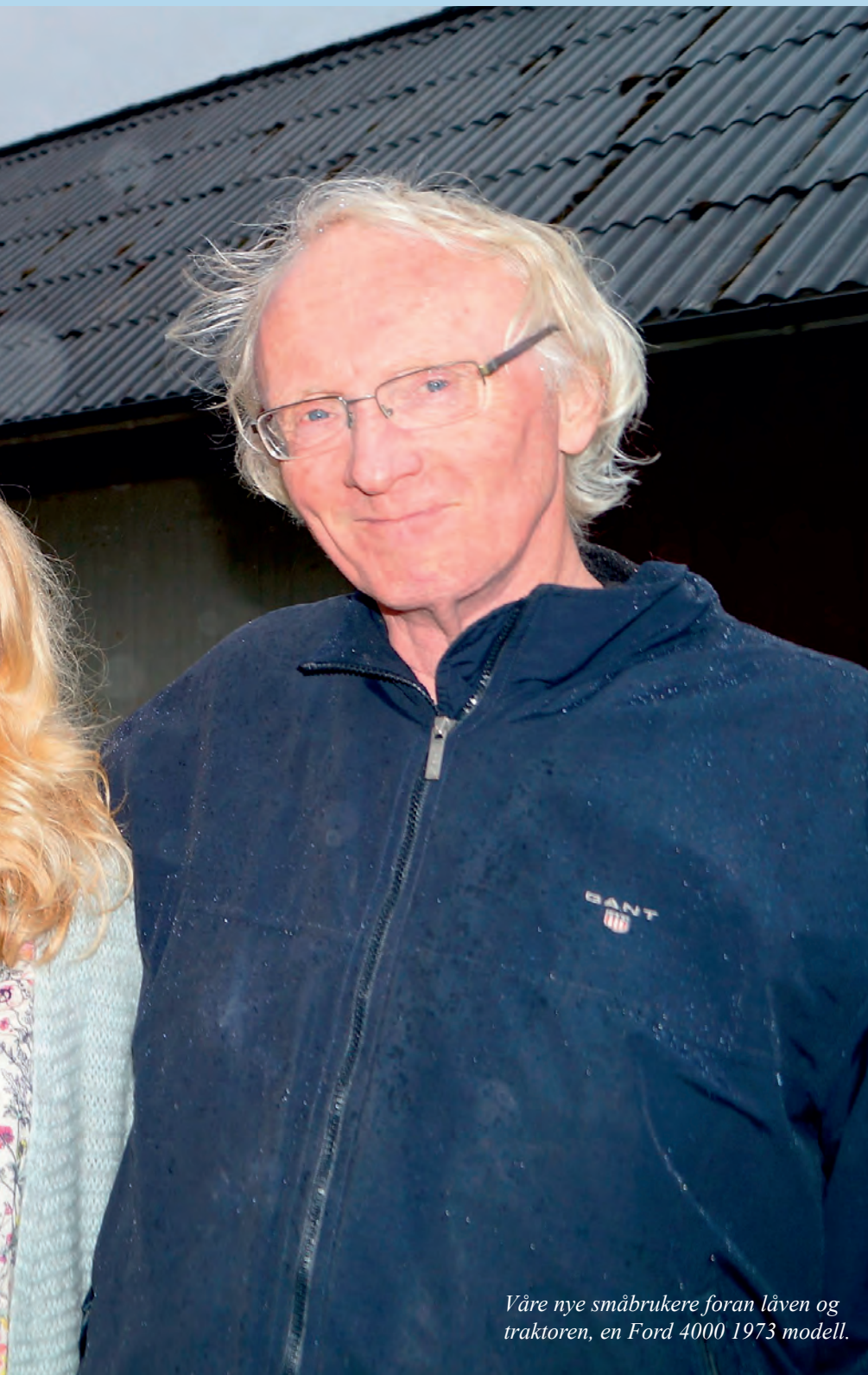
Våre nye småbrukere foran låven og traktoren, en Ford 4000 1973 modell.