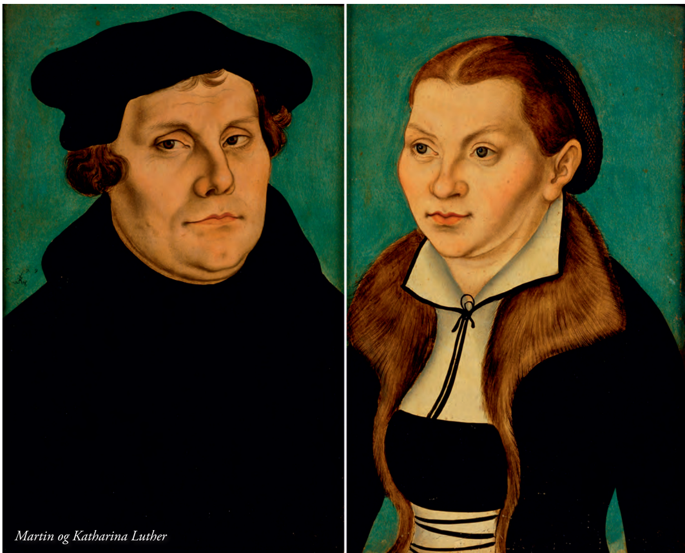
Martin og Katharina Luther