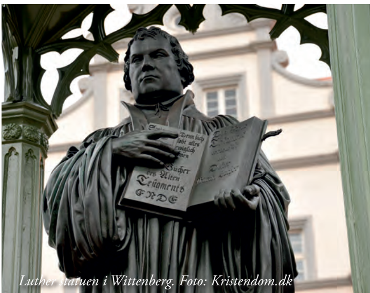
Luther statuen i Wittenberg.