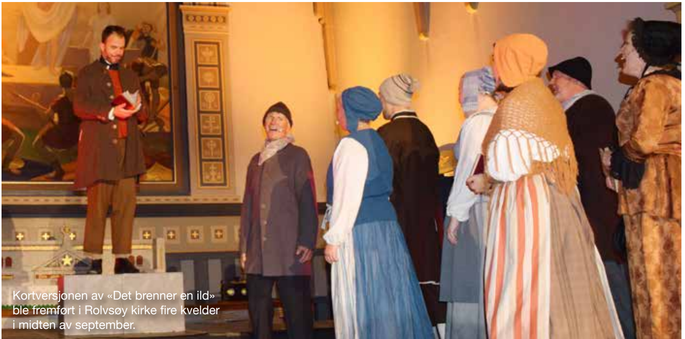
Kortversjonen av «Det brenner en ild» ble fremført i Rolvsøy kirke fire kvelder i midten av september.