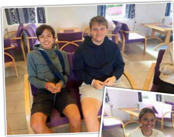
«Blide og fornøyde konfirmanter under gruppestund»,

Noen har sikkert lurt på hvorfor det ikke har stått noe i menighetsbladet om dette i år. Grunnen er, at høsten 1971 ble det ikke konfirmasjon i Rolvsøy. Kirken gikk over til konfirmasjon på våren isteden. Så dere som er konfirmert i Rolvsøy kirke 28. mai 1972, vil få invitasjon til et gjensynstreff våren 2022. Spre gjerne info om dette til kjente 1972-konfirmanter. Bilde vil komme i neste nummer av menighetsbladet.