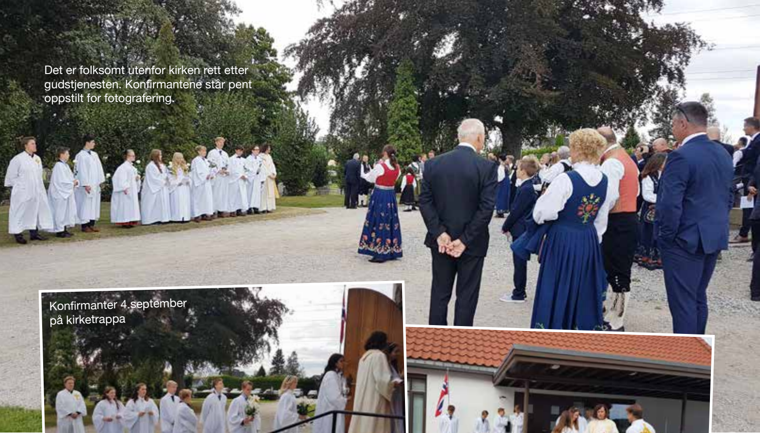
Konfirmanter 4. september på kirketrappa

Det er folksomt utenfor kirken rett etter gudstjenesten. Konfirmantene står pent oppstilt for fotografering.