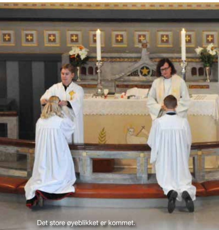
Det store øyeblikket er kommet.