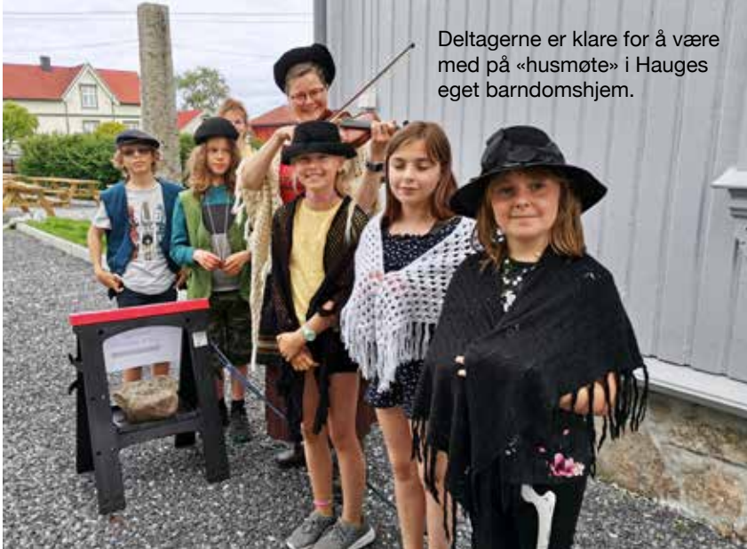
Deltagerne er klare for å være med på «husmøte» i Haugesundet barndomshjem.