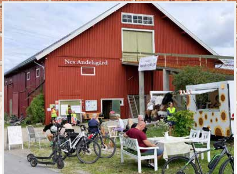
En trivelig og folksom dag på Nes andelsgård.

Hele andelsdriften er basert på tillit. Et styre/kjernegruppe vedtar sammen med gartneren og bonden hva som skal dyrkes.