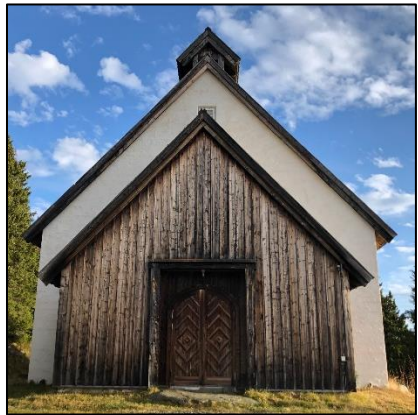
Tekst og foto: Kristin Garstad

Fjellkirken er eid av Stiftelsen Skei Fjellkirke og drives på dugnad. Kirken er åpen hver onsdag fra 30. desember til 31. mars, kl. 11-13, og tilbyr ellers gudstjenester og konserter i sesong. Kirken kan også leies for private arrangementer.