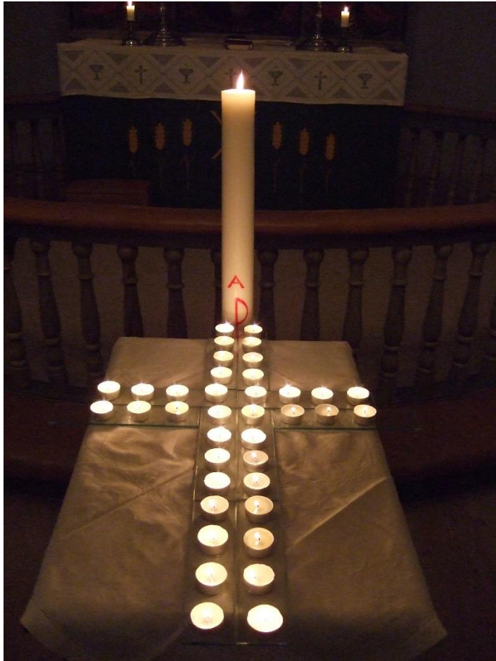
Allehelgensgudstjeneste i Gjerdrum kirke

I slutten av 2016 kjøpte menigheten et nytt digitalt piano av veldig høy kvalitet. Menigheten har i 2016 også kjøpt et trekkspill som bl.a. kan brukes på friluftsgudstjenester osv.