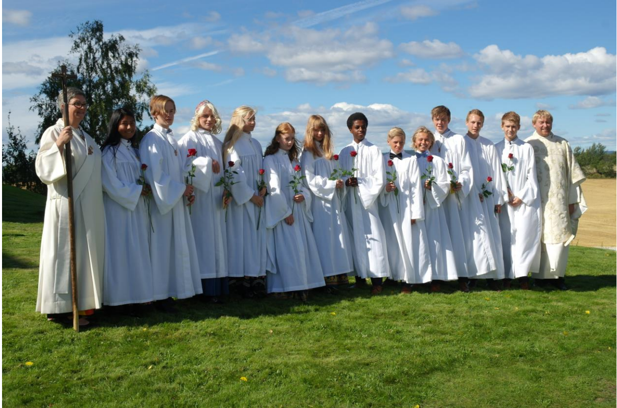
Konfirmanter fra 2016