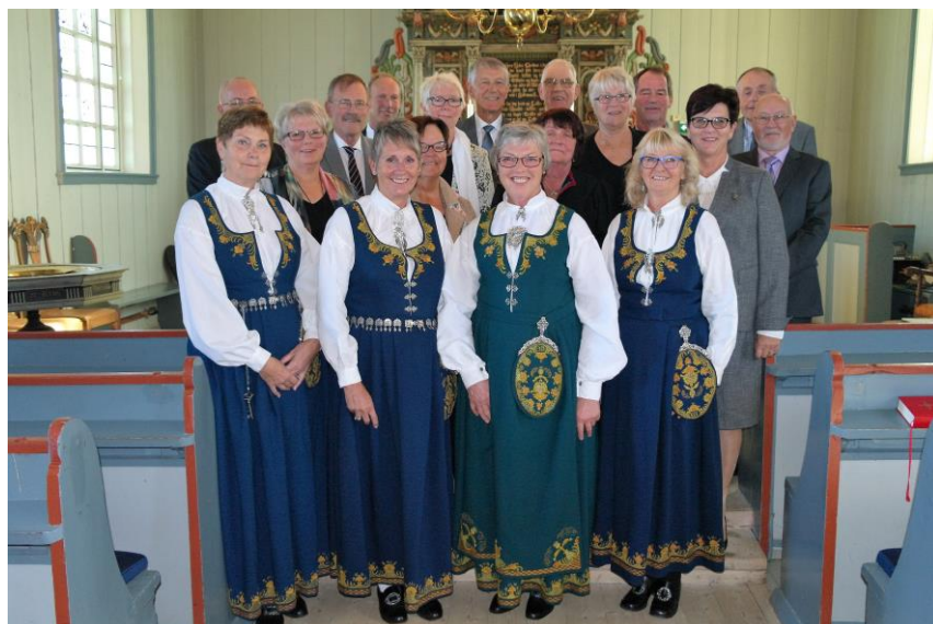
En flott gjeng med gullkonfirmanter 2016