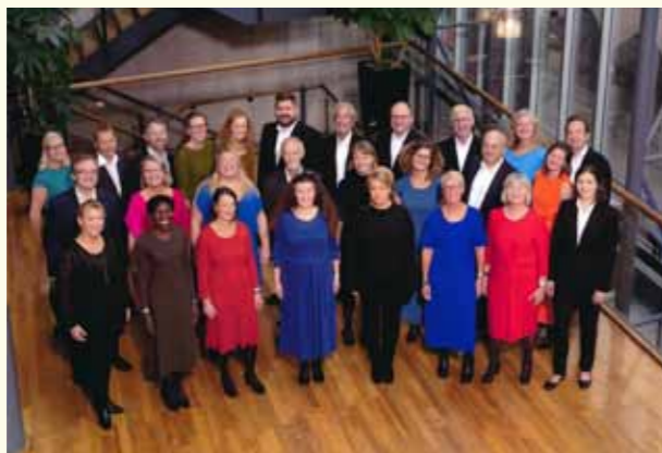
Koret Oslo Ø er et av tre kor deltar på framføringen av Dobrogosz jazzmesse 13. november.