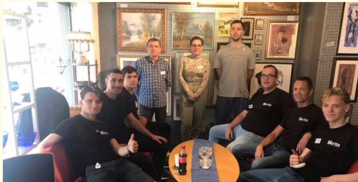
Maritastiftelsen har fått til et flott miljø i de nye lokalene i Storgata 8.