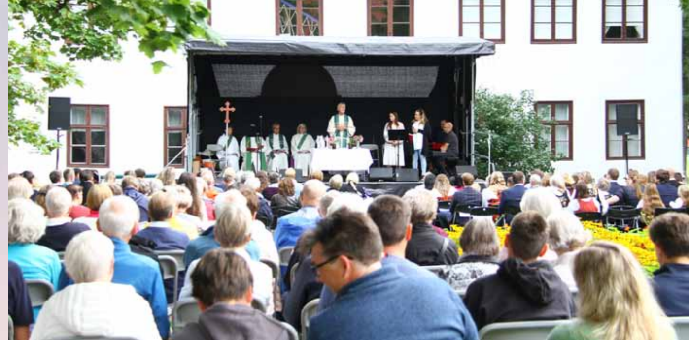
Foto på motsatt side: Fra friluftsgudstjenesten på Gjøvik gård 21. august.