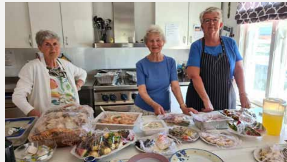
Kjøkkenmedarbeidere på Kampen.

sier daglig leder for PULS-Ditt værested, idet hun iler til verks for neste gjøremål.