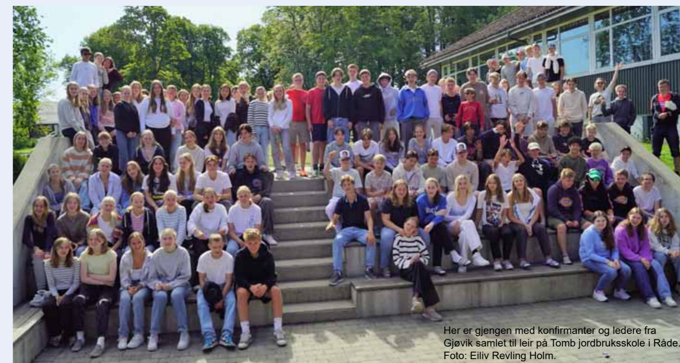
Her er gjengen med konfirmanter og ledere fra Gjøvik samlet til leir på Tomb jordbrukskole i Råde.