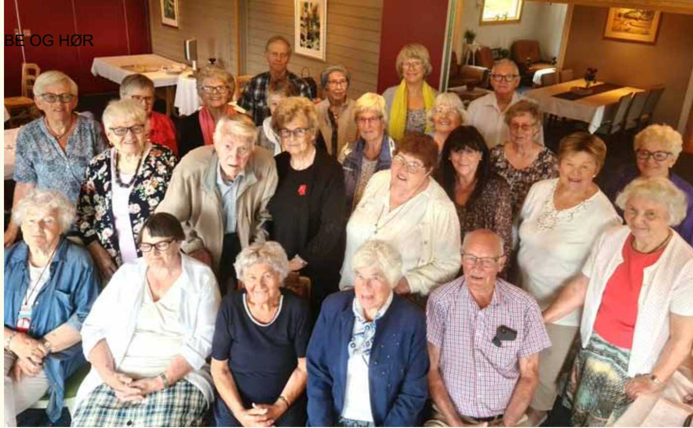
Menighetspleien i Hunn var på sommertur til Prestmarken på Hadeland 21.juni. Det meldes om god mat, hyggelig program og god stemning.