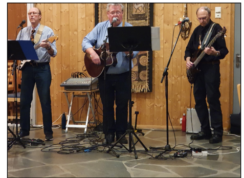
Overhaldens trio underholdt med fin sang og musikk