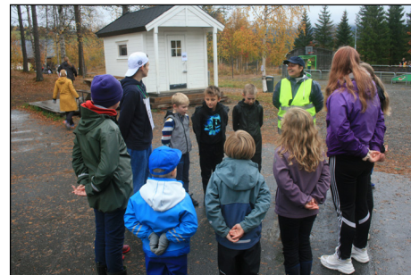
«Ta den ring og la den vandre»