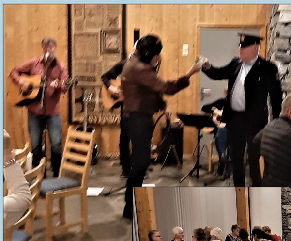
Viseklubben BØRRE. De fremførte gamle kjente låter, ispedd historier og skrøner