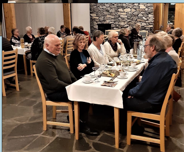
Gjestene hygget seg med god mat og drikke