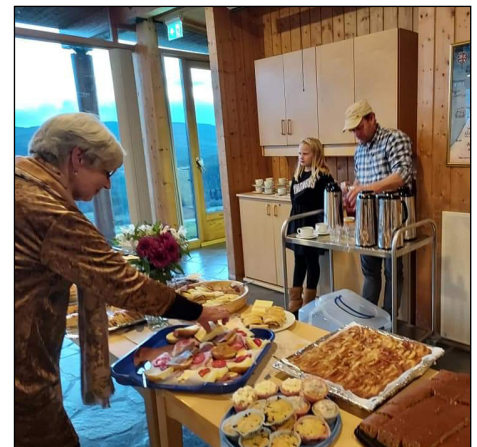
Det maglet ikke på noe å spise