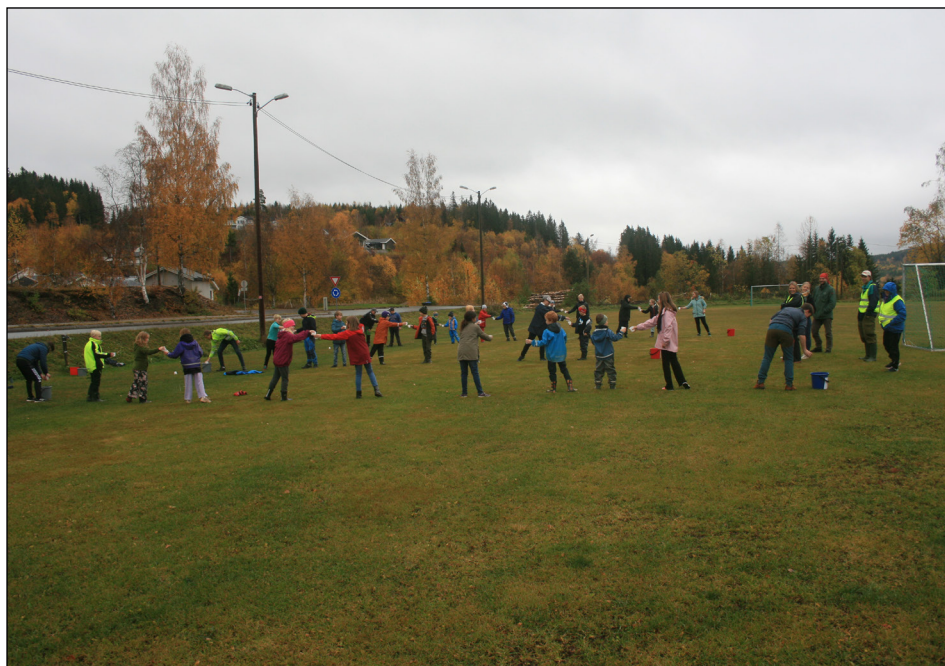
To og to lag konkurrerer i «vannstafett»