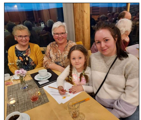
Blandt de mange som var der var 4 generasjoner fra samme familie