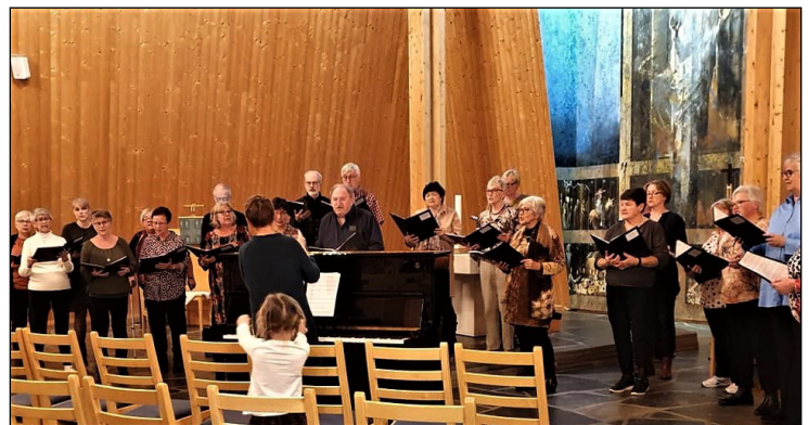
Kantoriet deltok også med fin sang