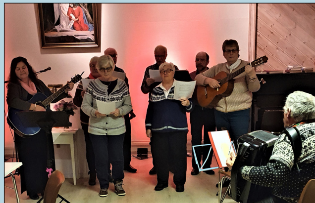
Gjennbruksmusikken fra Valdres deltok med frisk og god sang