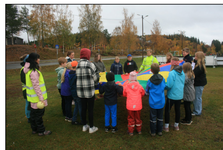
«Kaste baller med fallskjerm»