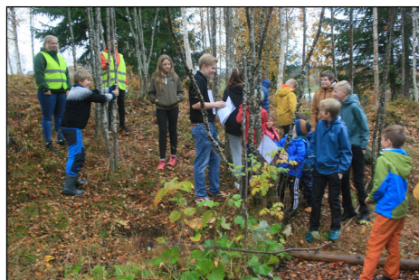
Samarbeid på en av postene i naturstien

Aktivitetene på fotballbanen krevde utvilsomt samarbeid. En av disse var «vannstafett»: To lag stilte opp i hver sin rekke. I den ene enden av rekka sto ei bøtte full av vann, i den andre en tom bøtte. Hver av deltagerne på laget ble utstyrt med et engangskrus, og førstemann i rekka fyller kruset med vann. Dette tømmes i kruset til den neste i rekka og så videre til den siste i rekka