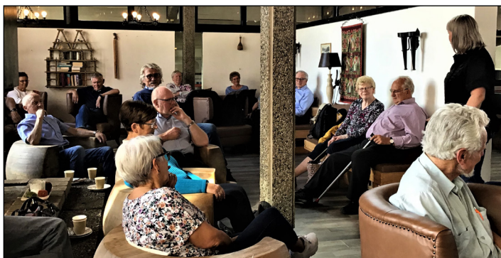
Turdeltakerene hygget seg på Spåtind hotellet

Da var tiden kommet for å samles til middag. Vi kom inn i en festpyntet sal og ble servert en nydelig 3-retters middag. Mette og fornøyde kom vi oss inn i bussen og Snertingdal Auto tok oss trygt hjem.