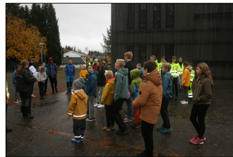
Nødvendig «briefing» før gruppene sendes av gårde til de ulike postene

Ta den ring og la den vandre er en lek som har eksistert i generasjoner i Norge. Det er vanskelig å si når leken egentlig oppsto, men de fleste i både foreldre – og besteforeldregenerasjonen til dagens elever har nok lekt denne. De som deltar står i ring vendt innover, med hendene bak på ryggen. En utvalgt går rundt med en ring som han/hun skal plassere i hendene til en av de som står i ringen. Dette gjøres usett, «i all hemmelighet». En annen utvalgt står utenfor ringen og skal gjette hvem som har fått ringen. Underveis synges «Ta den ring og la den vandre, fra den ene til den andre ...».