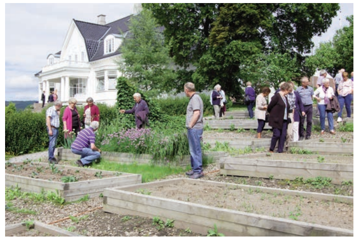
Høsten 2009 startet de arbeidet med å gjenopprette den gamle hagen som engang prydet området i forkant av hovedhuset.

Hotellet ønsker å ivareta lokale mattradisjoner, kulturlandskap og kulturhistorie, og bruker derfor en rekke lokale produkter i sitt kjøkken. Høsten 2009 startet de arbeidet med å gjenopprette den gamle hagen som engang prydet området i forkant av hovedhuset. De gamle grusgangen som slynget seg rundt eksotiske trær, lysthus og blomstrende trær skal nå gjenoppstå.