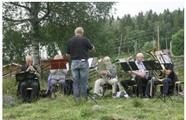
Musikkforening ga solid støtte til salmesangen

Olsokmesse til minne om Kong Olav den hellige er av katolsk opprinnelse. Det sier noe om denne hendelsen i