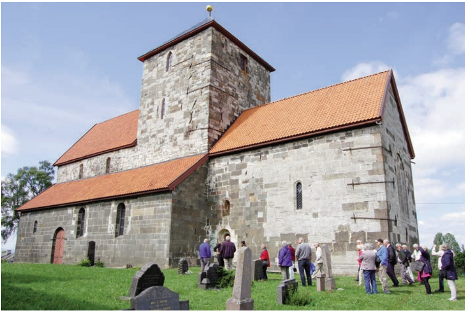
Nicolaikirken, den største av søsterkirkene

til hotell. Eiendommen er på 33 mål og ligger idyllisk til på en tange i den sydøstre delen av Ransfjorden.