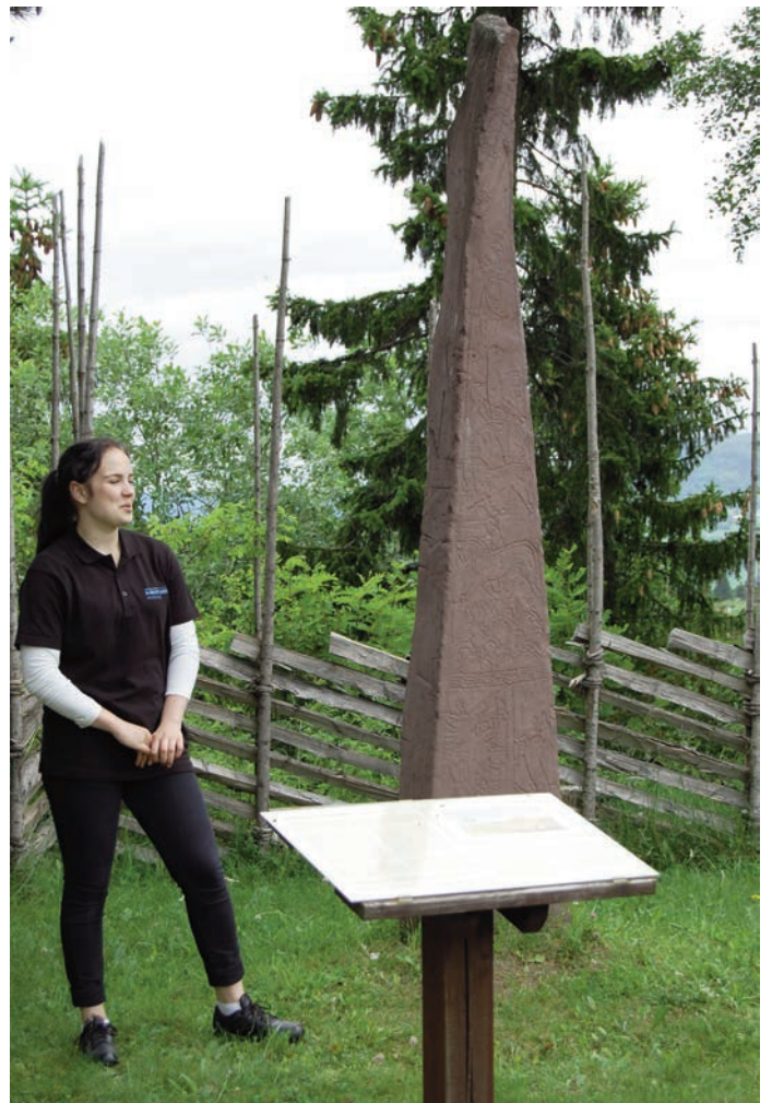
Dynnasteinen regnes for å være et av Norges tidligste kristne minnesmerker

Sagnet sier at det var to søstre som var uvenner og måtte ha hver sin kirke, men i middelalderen var det ikke uvanlig at det ble bygget flere kirker tett inntil hverandre, men med forskjellig funksjon.