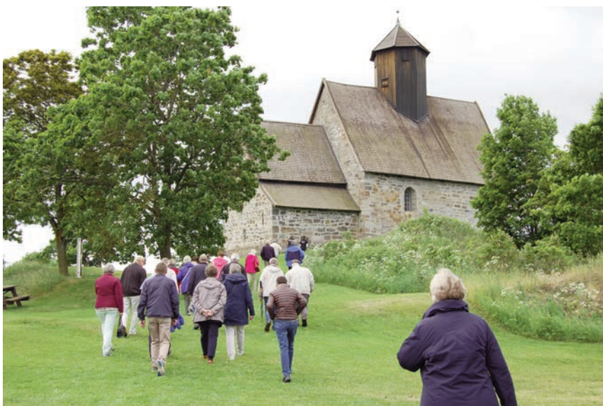
St. Petri (gamle Tingelstad kirke) bygget på 1220 tallet

Fra kirken gikk turen opp til Dynnasteinen som er en runestein fra gården Dynna. Den regnes for å være et av Norges tidligste kristne minnesmerker og Norges første billedmonument. Den er om lag tre meter høy og har bibelske motiver som er datert til om lag år 1050. Motivene på steinens forside forestiller