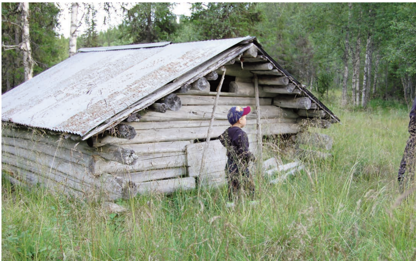
Utløa på Damsveslettet