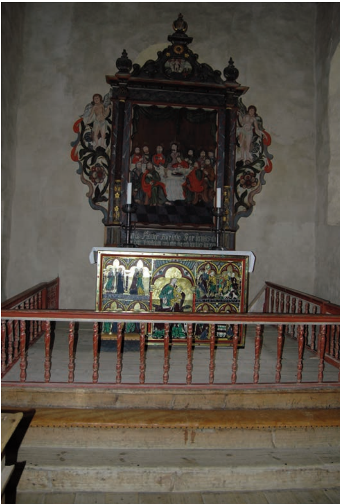
Altertavlen i ST. Petri er spesielt fin

Betlehemsstjernen, de tre vise menn, Jesusbarnet og gaveoverrekkelsen i stallen.