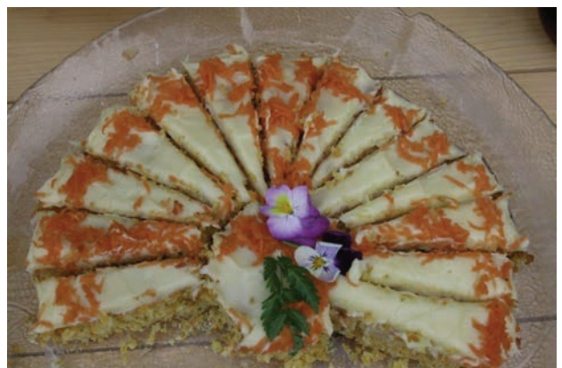
Det smakte med kaffe og kaker i regi av Snertingdal Bygdekvinnelag. Og noen av dem var spesielt vakre...

nåværende Nord-Trøndelag for snart 2000 år siden at feiringen av olsok som nasjonal høytidsdag overlevde reformasjonen og holder seg sterkt den dag i dag. Det borger nok for at det blir olsokmesse på kirkestedet ved Kirkerud også 29.07.17.