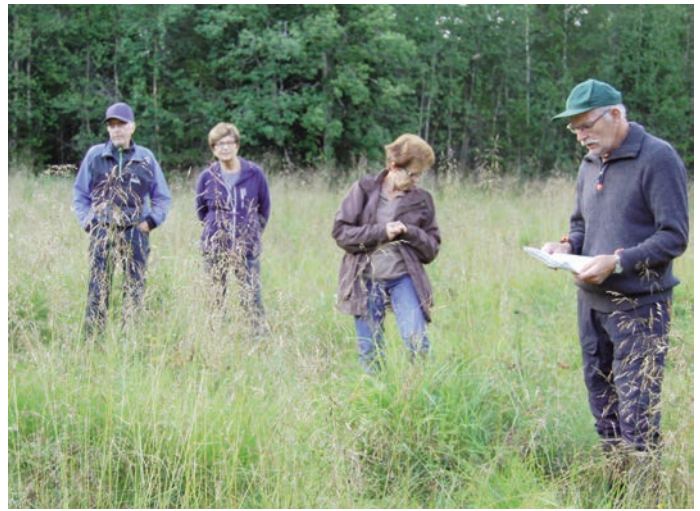
Noen av deltagerne på rusleturen

Dette var avslutningen på Årets rusleturer for gruppa i Nedre Snertingdal.