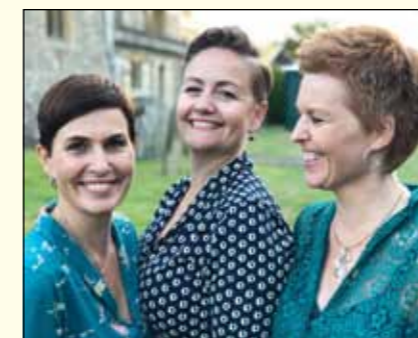
Trio Mediæval.