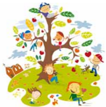
Illustrasjon: Elisabeth Moseng

BJONEROA - KORMIX Alder: Fra 1.-10. trinn. Øvelse torsdager kl. 14.00-15.30 i Sørums kirke. Kontakt: Kantor Marit tlf. 995 87 373.