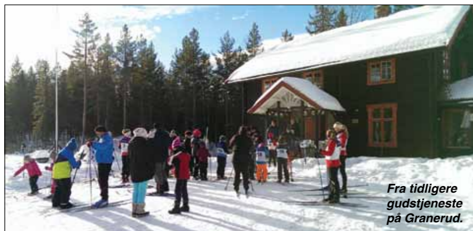
Fra tidligere gudstjeneste på Granerud.

Bjoneruas hytte, Granerud, midt i det vakre vinterlandskapet, blir fylt opp med glad Kormix-sang søndag