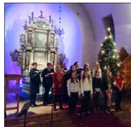
Medlemmer fra Kormix og Brandbu barne- og ungdomskantori sang på salmekveld i Norderhov kirke i januar.