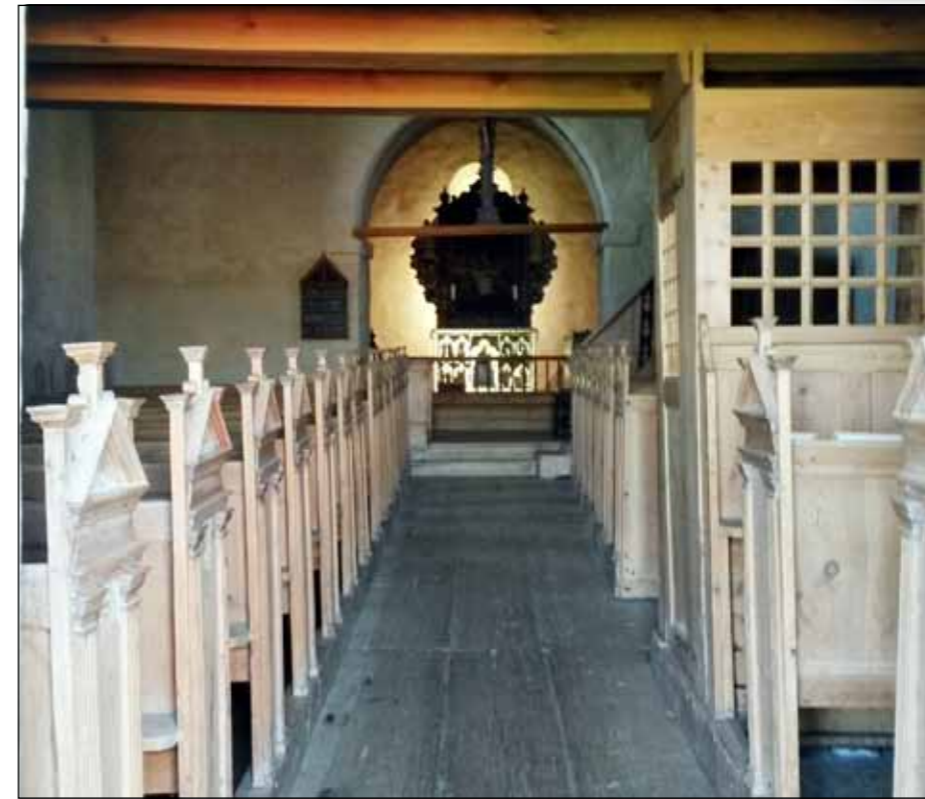
Innsyn i St. Petri kirke.

– Egentlig er det litt vemodig å ikke skulle være med videre, det skjer så mye spennende fortsatt, sier han, fremdeles full av engasjement for jobben. For eksempel hvordan vi skal