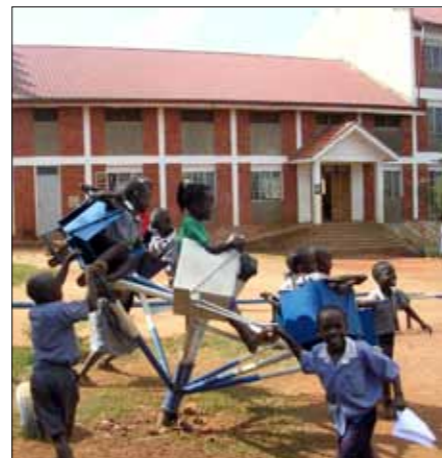
Etter skoletid på Joy school i Mukono.

Lesere som er interessert, kan kontakte Åge Bjerke på tlf. 922 86 091.