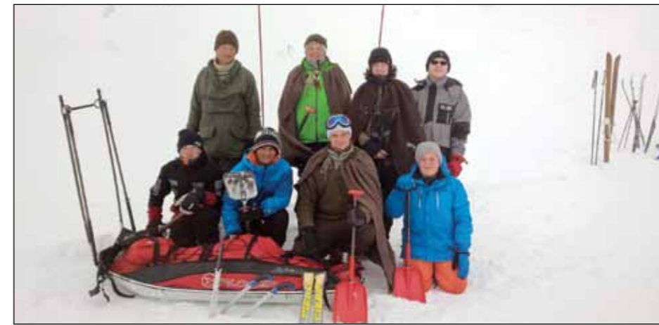
Granspeiderne etter overnatting i snøhule tur mars i fjor. Vi hadde sol dagen før da vi gravde en kjempfin snøhule på Vikerfjell. På bildet viser de frem alt det nye utstyret som vi hadde fått av Gjensidigestiftelsen til et prosjekt som het «Fjellet neste».