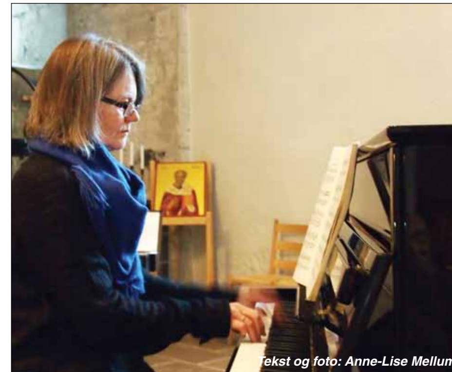
Tekst og foto: Anne-Lise Mellum

Alle vet at orgel er kirkens instrument. Men noen ganger er pianoet mer velegnet. Det gjelder akkompagnement til solosang i begravelser og på konserter. Samtalen ble avsluttet med at kantoren ønsker å takke Gran kirkelige fellesråd og Gran/Tingelstad menighetsråd som har gått sammen om å skaffe nytt piano til Nikolaikirken. På vegne av menigheten vil også Kirkebladet komme med sin hjertelige takk.