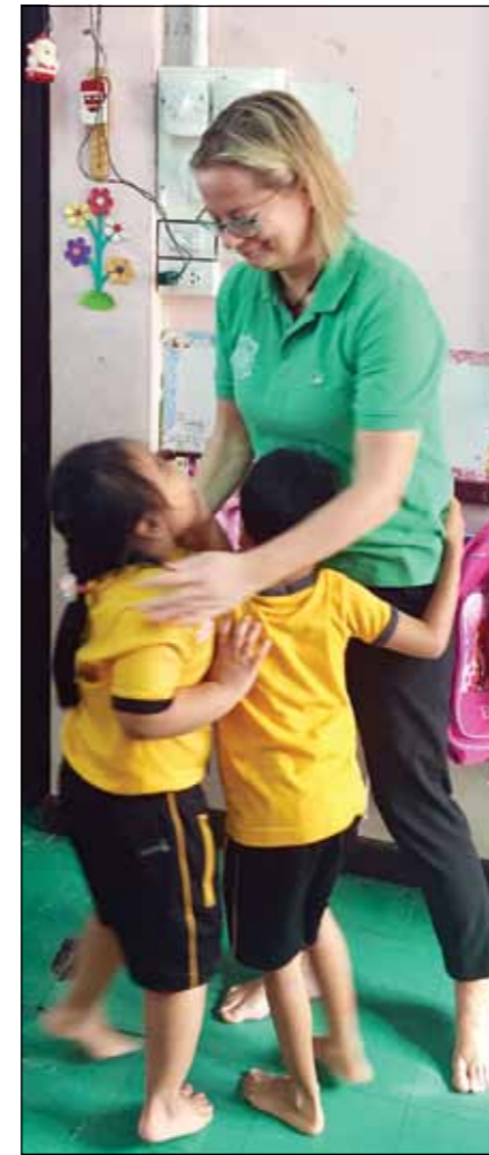
Førskolebarna på Immanuel kirken gjenkjente Margrethe med en gang og trakk henne inn i leken.

barnehage og førskole for nesten 60 barn mellom 2 og 6 år. Det gjøres hjemmebesøk og foreldresamtaler. De samarbeider med myndighetene og utfører utviklingsvurderinger av barna. De med de største utfordringene får tilbud. Dette er eneste mulighet for de fattigste av de fattige fra slummen til undervisning og framtidig utdanning. På den lokale skolen utmerker barna fra barnehagen seg og klarer seg ofte bedre enn sine jevnaldrende. Det koster kun 500 Bath/mnd eller 125 NOK/mnd per barn i førskolen. De gir også musikk undervisning i sang og fiolin. Dette har vist seg i tillegg til engelskundervisning å være en vei ut av fattigdom. Undervisningsopplegget har fått svært gode tilbakemeldinger fra myndighetene i Thailand. Etter 20 år kommer tidligere studenter tilbake med bachelor og master diplomer.