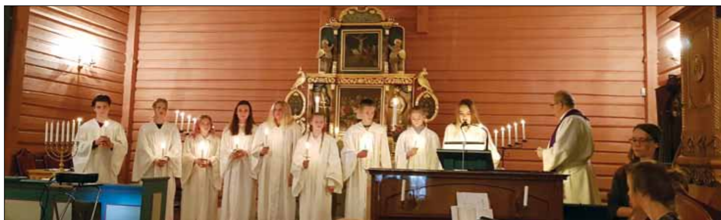
Årets konfirmantkull i Bjonerøa under lysmessen i Sørur kirke 3. desember.