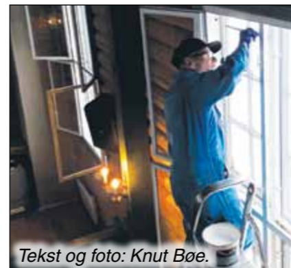
Tekst og foto: Knut Bøe.

Ettersom Magne er en handlingens mann, avsatte han en god del timer, fikk maling av en annen giver og satte i gang. Nå ser alt så mye bedre ut. Stor takk til Magne for denne fine gaven!