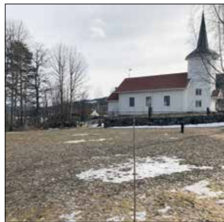
Bildet gir en viss formening om hvor urnefeltet vil ligge i forhold til kirka.

En navnet minnelund betyr at folk som ikke lenger bor i bygda kan ha et gravsted for sine kjære som blir stelt av kirkegårdsarbeidere. Det spares plass