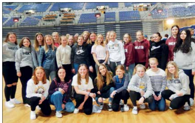
En samling av jentene fra vår kommune i full fart og aksjon i Håkons hall!

Takk til alle som deltok og for gode minner!