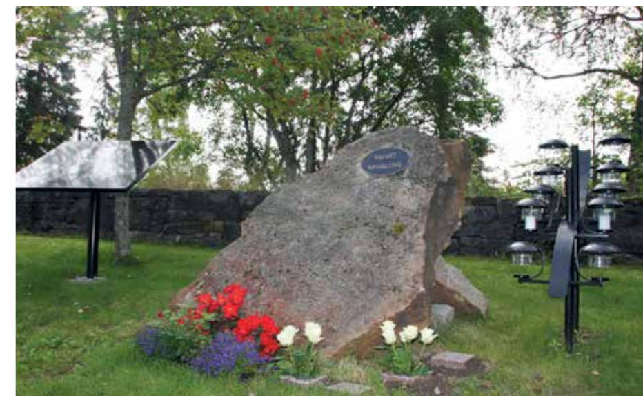
Navnet minnelund Nes kirkegård.

minnelund – det vil si et urnefelt hvor urner kan settes ned og hvor de pårørende kan være med ved urnenedsettelsen. Her finnes en felles plate med navneskilt - og det er anledning til å tenne lys og pynte med avskårne blomster på angitt sted. Det er også ett felles plantefelt hvor kirkegårds-