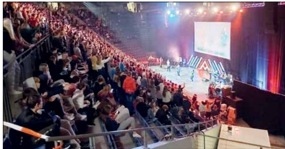
Det synges av full hals under fellessamlingen i Håkons hall.

Slalåm, aking, svømming, og musser var på listen over tilbud de unge kunne velge blant. Å høre over 1000 konfirmanter synge «Deg være ære» kompet av et skikkelig rockeband var en herlig opplevelse for en gammel sokneprest. Fra scenen ble det lest bibelhistorier av en skuespiller og det grep tydeligvis mange sterkt. Mange nye vennskap ble knyttet og noen fikk litt hjertebank i møte med en kjekk gutt eller jente.