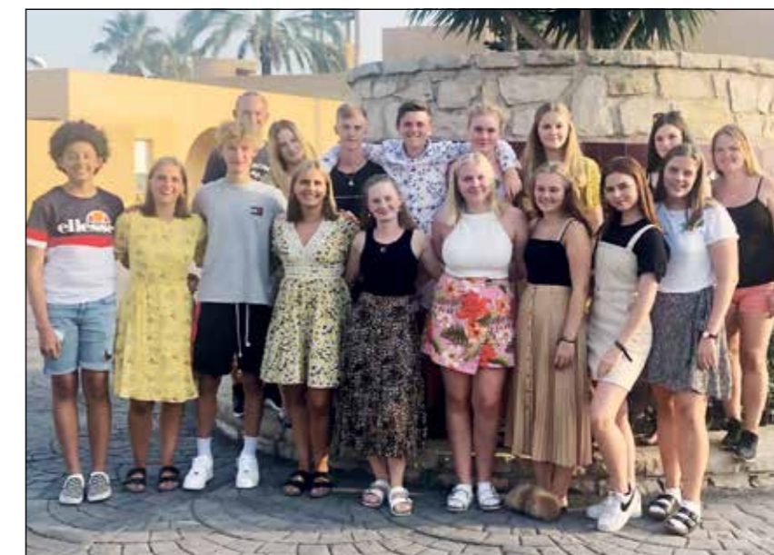
Vi skulle hatt et situasjonsbilde fra første samlingen 13. mars med ungdomskveld og MiLK-kurs, men pga. koronaviruset ble denne kvelden avlyst. Derfor setter vi på et flott bilde fra turen de første MiLK-deltagerne med ledere hadde til Spania i fjor høst.