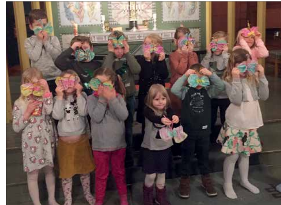
I mars var det 6-årsbok-samlinger i kirkene. Barn og foreldre ble invitert til påsefest en kveld før gudstjeneste med utdeling av 6-årsbok. Her er alle 6-åringene som møtte i Ål kirke 5. mars og sang, lekte og hørte en bibelfortelling. Også laget de hver sin flotte sommerfugl!

SøndagsLIV, Jaren Misjonshus: Annenhver søndag kl. 16.30 (partallsuker). Gudstjeneste for hele familien. Eget opplegg for barna. Samlingen avsluttes med et måltid. Se Jaren misjonshus sin FB-side for mer info. Kontakt: Ellinor T. Haldorsen, tlf. 993 56 453.