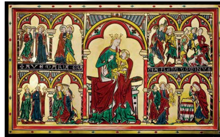
Rekonstruksjon av alterfrontalet i gamle Tingelstad kirke/St. Petri 2012.

Fra Maria på alterfrontalet i St Petri, dirrer sangen om tro, mot og tydelighet på Guds vilje om rett og rettferdig-