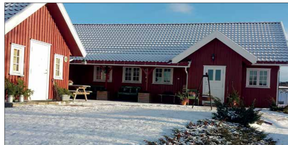
Sysselfgården i vinterdrakt.

Vi gratulerer både komponist og tekstforfatter!