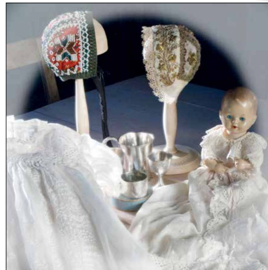
Unike skatter fra Dåpsmuséet på Sysselfgården.

I tillegg til systue, butikkutsalgsalg og museum, rommer bygningen også et stort rom som brukes til utstillinger, kafé og utleie for ulike arrangementer. Her osrer det av gammel historie og lukta av hjembakt kringle sitter nærmest i veggene. – Ja, jeg får mange tilbakemeldinger om at her er det godt å