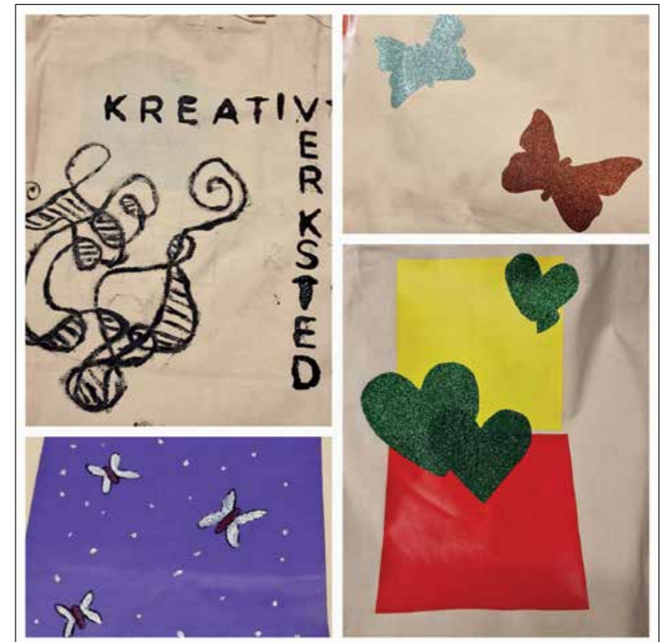
Collage av spennende vinyltrykk som er laget av de unge på Kreativt Verksted Glasslåven.

Begge tilbud er gratis og er et samarbeid mellom UngHadeland, Glasslåven kunstsenter og Kirken i Gran. Kontaktperson: Diakon Lene B. B. Rødningsby – tlf. 959 67 289, LB853@kirken.no