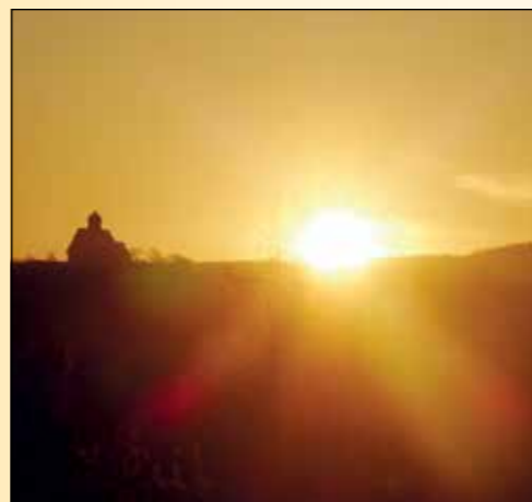
Soloppgang ved St. Petri.

Påskedag ved Ål kirke.