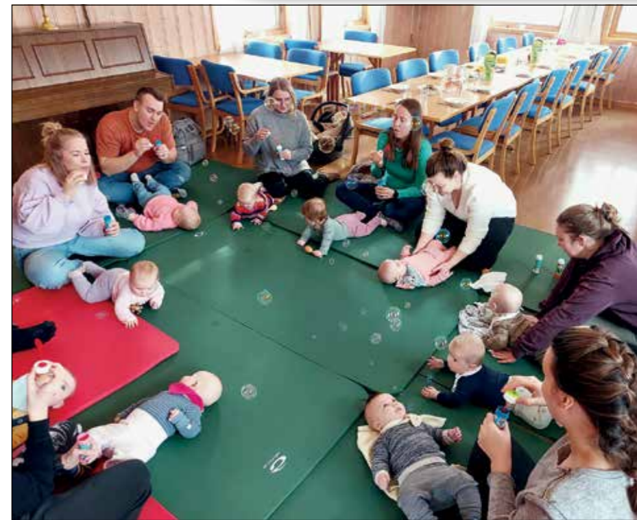
Vi lytter til Velsignelsen mens vi blåser såpebobler, og langbord er dekket bak.