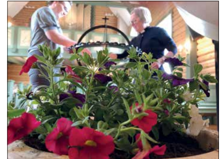
Lysgloben i Moen kirke tennes.

Vi må aldri slutte å minne oss selv og hverandre om at håpet om en morgendag der kjærligheten og omsorgen får råde oss mennesker imellom, det er et håp Gud har lagt i våre hjerter. Vi håper på en fremtid der godhet og vennskap skal få råde