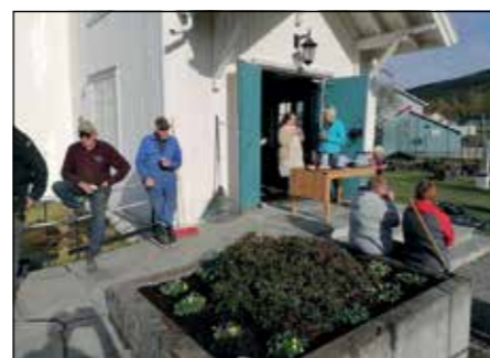
7. mai var det igjen tid for å pynte opp på kirkegården etter vinteren. Det er godt oppmøte på dugnader i Bjonerøa, og denne kvelden var intet unntak.

Nå er målet å gjøre kjørka hvit og vakker før vinteren!