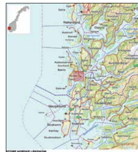
Moster.

Snorre forteller om Olav Trygvason at han i 995 «kom seglande av hav ytterst på Moster. Der gjekk han fyrst i land i Noreg, og der let han syngje messe i telta på land». Den første kristne messe var holdt i Norge, og