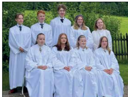
Årets konfirmanter i Sørums kirke.