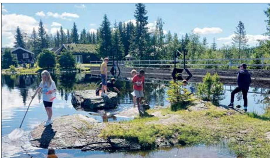
I starten av skoleferien hadde vi sommerleir på Sagvollen for rundt 30 barn i barneskole-alder. En dag for de minste barna i 1.-4. klasse og dagen etter for barn i 5.-7. klasse. Vi koste oss med aktiviteter, leker og konkurranser i skogen og ved vannet i strålende sommervær.