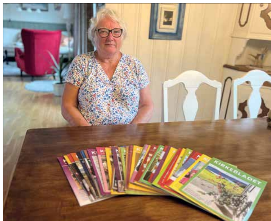
Snart 10 år med grafisk ansvar for Kirkebladet.