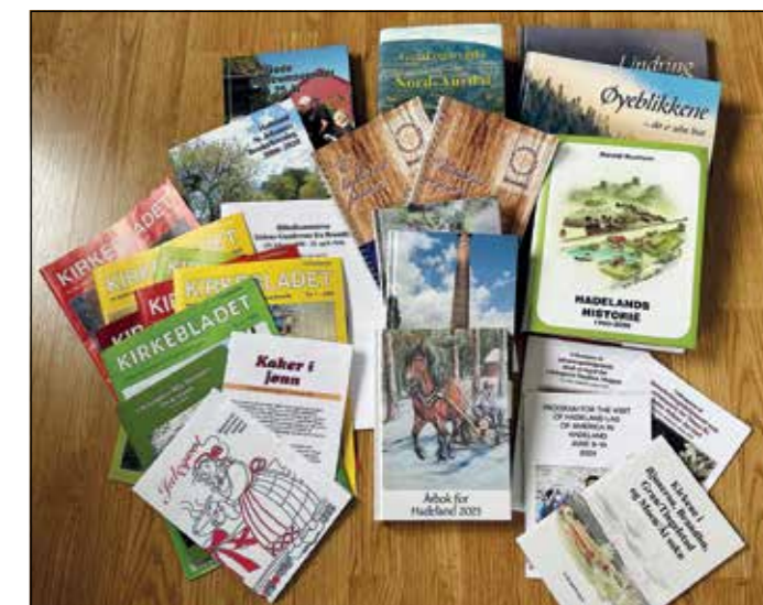
Noe av produksjonen de siste åra.

- Og neste år skal jeg være frivillig på Landsskytterstevnet på Kongsberg, da heier jeg videre på barnebarna, smiler hun i det vi tar farvel på trappa!