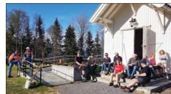
Dugnadsgjengen i Bjonerøa tar kaffen på kirketrappa i ettermiddagssola, fra dugnaden i mai 2018.

Ål ..... tirsdag 23. april Tingelstad og Grymyr ..... onsdag 24. april Nes ..... torsdag 25. april Moen ..... mandag 29. april Søsterkirkene og Sørum .... torsdag 2. mai