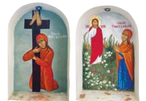
Ikonene med Maria Magdalena er fra retreat - og opplæringscenteret Anafora i Egypt.