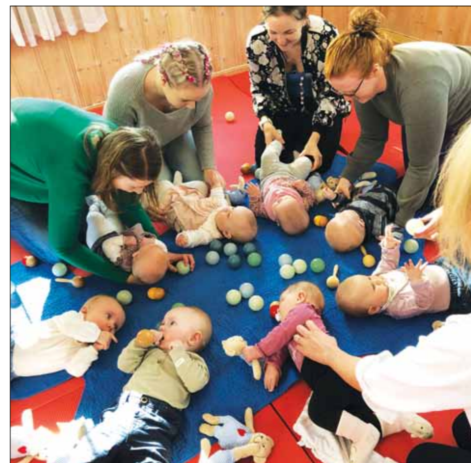
Full babysanggruppe denne våren i Moen kirkestue.