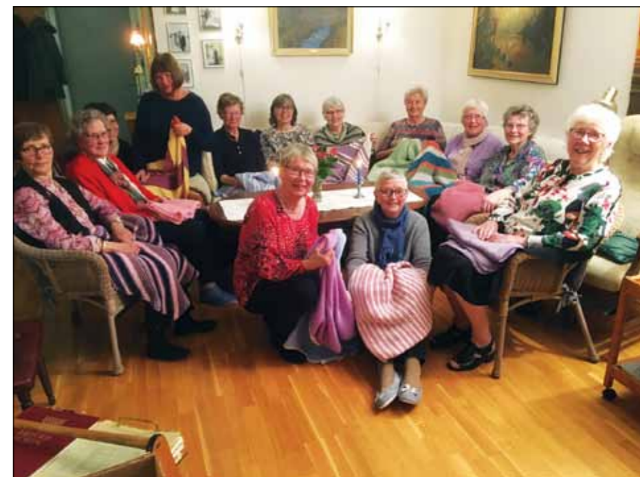
Vassenden misjonsforening med sine strikkede tepper til babyer i Etiopia.

Områdestevnet er alltid en god inspirasjonskilde for både misjonstanker og mellommenneskelige forhold. Vi håper at mange benytter anledningen til å delta på årets områdestevne på Tryggheim, rett sør for Coop-bygget i Gran sentrum.