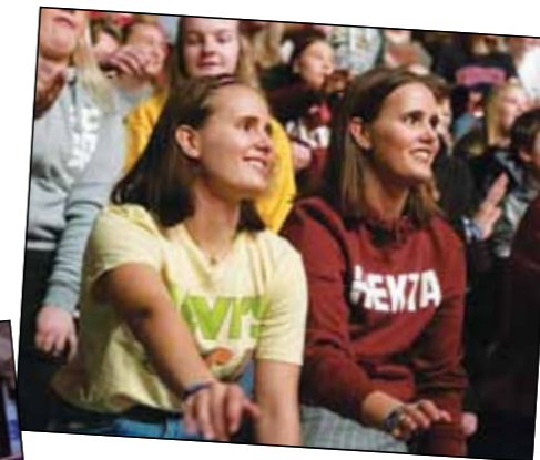
På bildene ser dere et knippe av konfirmantene fra menighetene i Gran i aksjon – og et par foreldre i sving med bømme og klut.

Alle konfirmantene ble samlet igjen 21. mars til felles filmopplevelse «Oppstanden» på Brandbu kino. Filmframvisningen ble støttet av menighetsrådene.