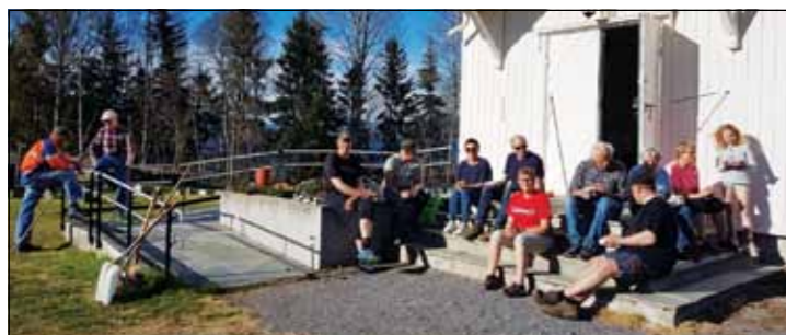
Dugnadsgjengen samlet til kringle og kaffe på kirketrappa.

Frammøtet var stort, 22 personer raket og ryddet Sørur kirkegård i strålende sol tirsdag 8. mai. Gran kirkelige fellesråd og Bjonerua menighetsråd setter utrolig stor pris på alle som bruker tid på å rake vekk gammelt løv og rydde opp på kirkegården. Det er verdifull hjelp, og det ble i tillegg en