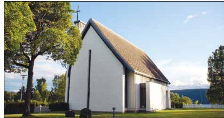
Grymyr kirke i vårpusset stemning!