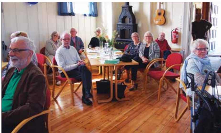
Deltakerne samlet til en dag med årsmøte, misjonsfest og masse inspirasjon i Nes kirkestue.