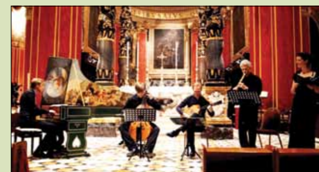
Ensemblet «L'État Libre de Neige».