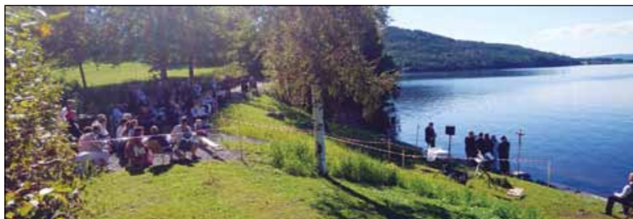
Fra dåp ved Nes i 2017.

Først ut kl. 11.00 er det dåpsgudstjeneste på stranda ved Nes kirke. Flere barn skal døpes og soknepresten vil øse Randsfjordvann over de små hodene og gi dem Guds velsignelse for