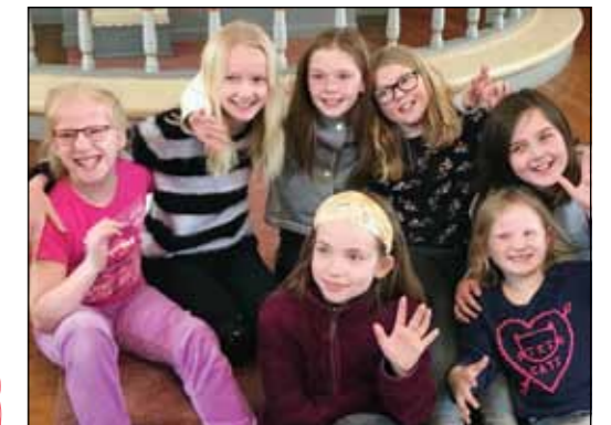
Kormix i Bjonerøa.

Kontakt kontor Marit Wesenberg, tlf. 995 87 373, for mer informasjon.