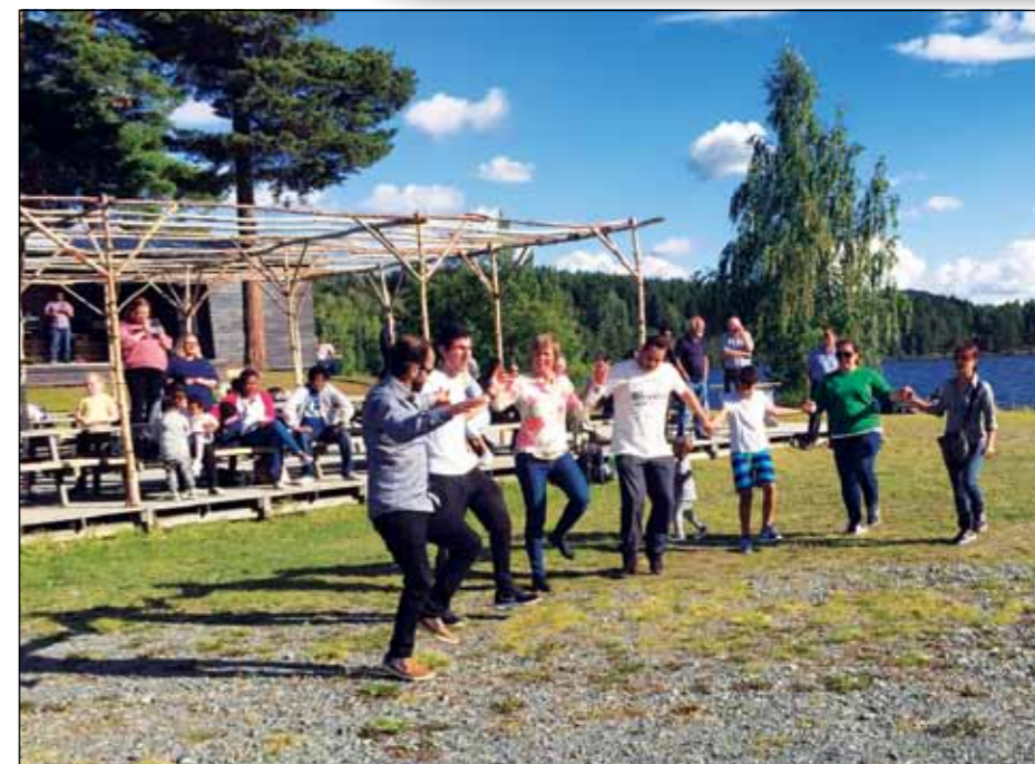
Fra Badstufesten 2017.

Entré kr. 50,- for voksne. Gratis for barna og for de familiene som har med mat til fellesbordet. Loddsalg med ge-