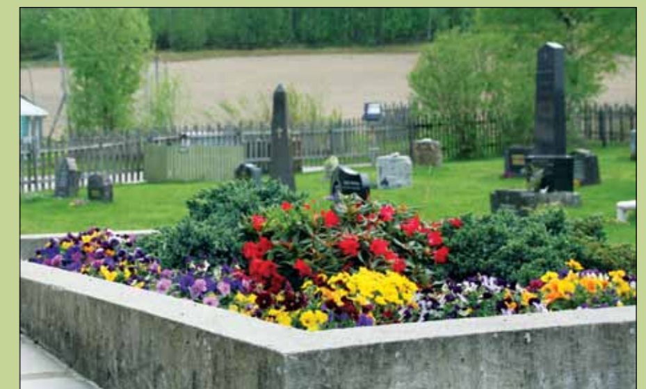
Velstelt på Sørum kirkegård sommeren 2017.

Vi vil som tidligere år bestrebe oss på å holde kirkegårdene i så fin stand som mulig gjennom hele sommerse-