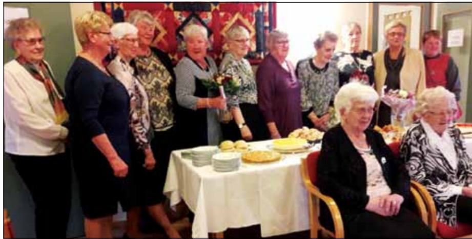
Ål kirkering under jubileumsfesten 27. april.

God stemning da Ål kirkering feiret sitt 60-års jubileum i LHL-bygget. Foruten kirkeringen sjøl (se bildet), så var mange gjester invitert. Det ble servert nydelig middag og kirkeringens damer stilte opp med kaker som bare de kan det. Kirkeringens gamle protokoller lå framme, og det var spennende å lese i om hva kirkeringen gjennom 60 år har fått bety for kirka. Tusenvis av kroner er blitt samlet inn og gjort om til utstyr som kirka har trengt, og de har tatt ansvar for utallige kirkekaffe serveringer. Men det er ikke bare Ål kirke som har fått nytte godt av kirkeringens engasjement. De første 10-årene sørget kirkeringen blant annet også for at det hver jul ble kjøpt inn julegodter til beboerne på Gran sykehjem. Men ikke bare har kirkeringen betydd noe for andre, det fellesskapet kvinnene