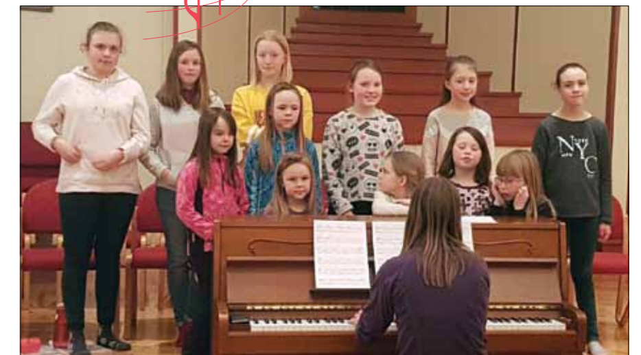
Brandbu Barne- og Ungdomskantori øver i Nes kirkestue.