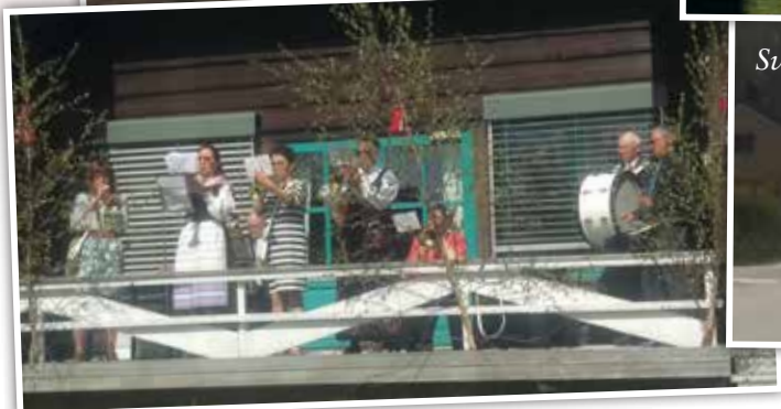
Svullrya - Eldrehuset