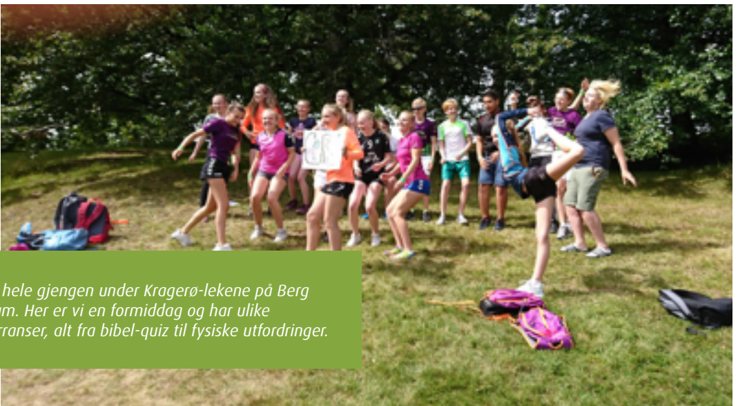
Her er hele gjengen under Kragerø-lekene på Berg museum. Her er vi en formiddag og har ulike konkurranser, alt fra bibel-quiz til fysiske utfordringer.