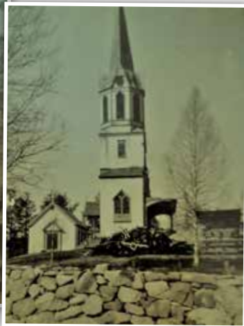
Bilde til venstre: Grue Finnskog kirke før sammenbruddet vinteren 1948. Bilde til høyre: Grue Finnskog kirke etter sammenbruddet vinteren 1948.