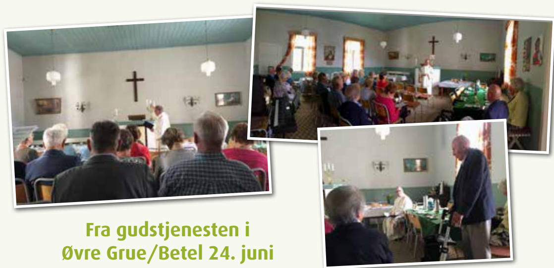
Fra gudstjenesten i Øvre Grue/Betel 24. juni

I budskapet om Guds rike skulle det ikke være plass for eller rom til bygdedyret, likevel, ikke sjelden lever det godt på andres og våre forhistorier og nederlag. Egentlig skulle det være slik at den som tår over dørstokken til kirka ikke lenger opplevde å bli stilt til veggs på grunn av sin fortid, men ble møtt med miskunn og barmhjertighet. Det er ikke bare ulven som kler seg med fåreklær, bygdedyret gjør det også. Av alle bygdedyr er kanskje den fromme varianten den aller farligste.