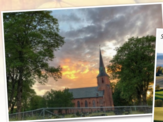
Vestby kirke i Akershus.