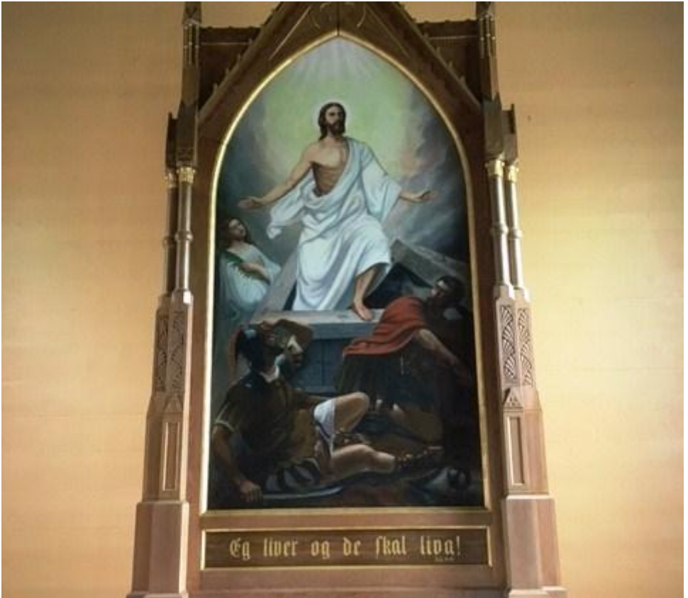
Altartavla i Mjømna kyrkje, sjå meir side 2