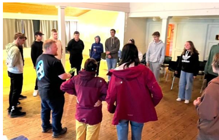
Arkivfoto frå ein pizza- og kinokveld i Eivindvik, 2022

Både på Byrknes og i Brekke stilte sokneutvalgene flott opp med tilrettelegging og de nydeligste retter til pizza- og kinokveld. Dette setter vi utrolig stor pris på, og er noe som gir både ledere og ungdommer mulighet til å bygge nye vennskap. Slike pizza- og kinokvelder hadde vi også i Eivindvik og på Dalsøyra.