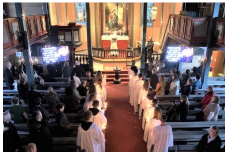
Arkivfoto frå lysmessa i 2022.

Laurdag 7. oktober var konfirmantane med på ei ungdomshelg i Hyllestad, og 25. november var det lysmesse med alle konfirmantane i Gulen kyrkje.