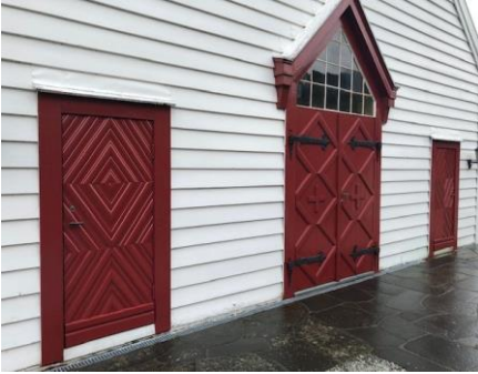
Nymålte kyrkjedører i Brekke.

Der er installert varmestyring i kyrkja som eit tiltak for å få betre kontroll med oppvarminga, utan at ein må møte opp i kyrkja. I forkant blei det bytt ut nokre gamle panelomnar, særleg var den i prestesakristiet moden for utskifting. Hovuddørene i kyrkja og dørene i bårhuset fekk seg eit etterlengta målingsstrøk, dette arbeidet blei utført på dugnad.