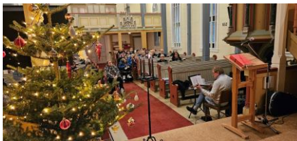
«Vi syng jula inn», Mjømna kyrkje.