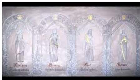
«Guds fire døtrer»

kvar domsavseiing der lova var uklar, skulle bli høyrd for at ein dom kunne seiast å vere opplyst og rettferdig: Miskunn, rettferd, sanning og fred.