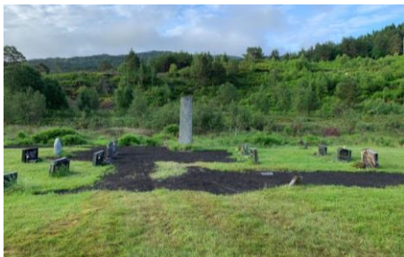
Utbetring og påfyll av jord på Rutle.

Opprustninga av denne gravplassen har halde fram i 2023, og oppryddinga av felte tre blei ferdig i løpet av våren. I august blei det fylt på jord, jamna ut holer og lagt på masse langs kanten mot utmarka for å få ei jamnare høgde før oppsetjing av gjerde.