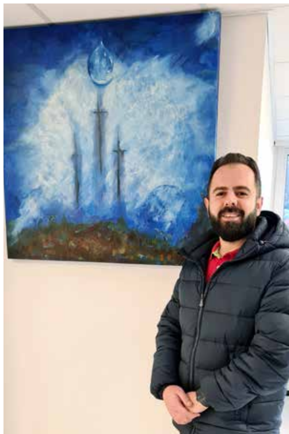
Tekst og foto: Andreas Ester

Eg har ikkje møtt foreldra mine og broren min på heile 9 år! Heldigvis er det mogleg å vere i kontakt via telefon og andre kanalar. No søker eg om å få norsk pass for å kunne reise til Tyrkia og treffe dei der. Eg håpar det går i orden snart!