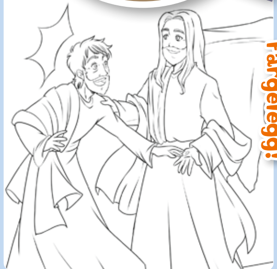
Teikning: Chiara Bertelli