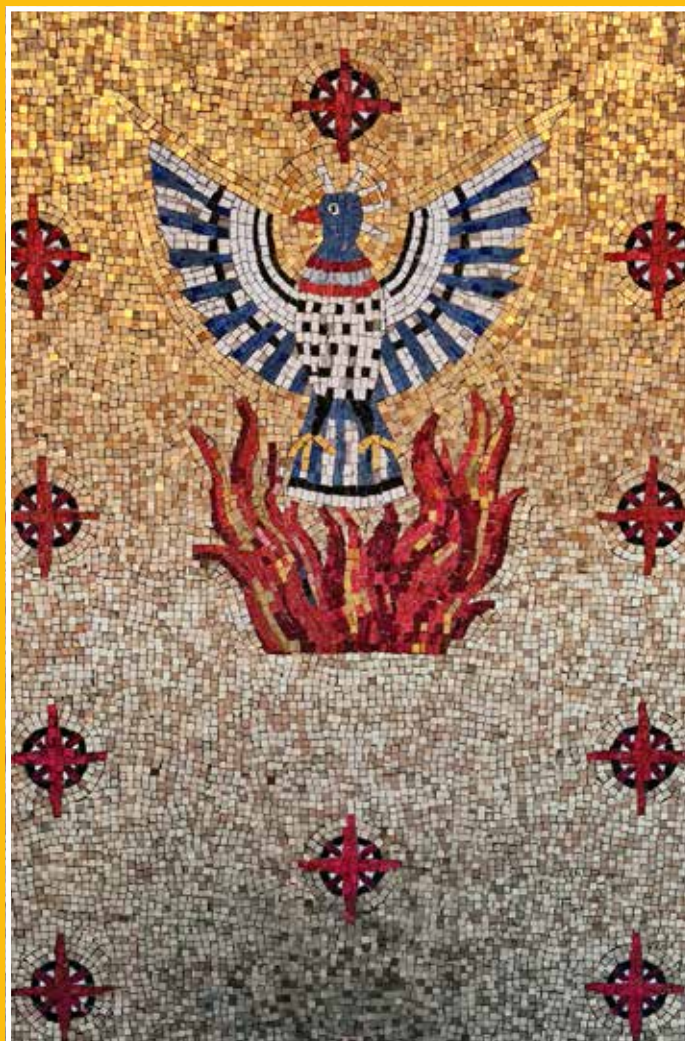
Fugl Fønix motiv i Høyanger kyrkje.