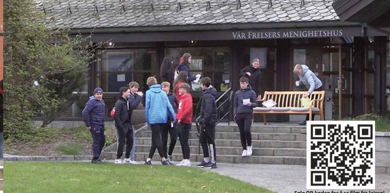
Følg QR-koden for å se film fra leiren!