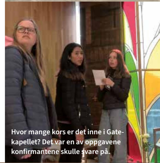
Hvor mange kors er det inne i Gatekapellet? Det var en av oppgavene konfirmantene skulle svare på.