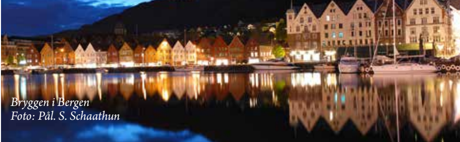
Bryggen i Bergen

Vil du være med på menighetenes høsttur 2017 må du sette av dagene fra mandag 21. til torsdag 24. august.