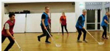
Innebandy er en klassiker på KRIK Udland. Konkurranseninstinktet kan være sterkt, men leken er viktigst.

Det var interessant å høre på ungdommene fortelle, og jeg la merke til at noen har gått lenge på KRIK, og noen har vært bare noen få ganger. For min egen del vil jeg si at KRIK er som en familie for meg. Det er et sted å finne fellesskap, ha det gøy, få nye venner, lære mer om Jesus og være med på forskjellige sportsaktiviteter.