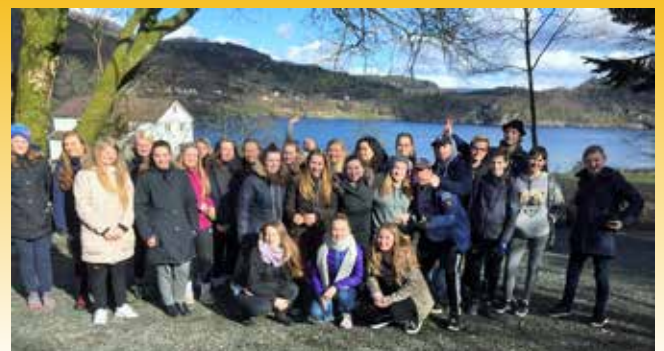
Ledertreningsungdom fra flere menigheter var samlet i Nedstrand.

Helgen 18.-19. mars var en flott gjeng samlet i Nedstrand. MILKere (ungdom i ledertrening året etter konfirmasjonen) fra Rossabø, Vår Frelses, Skåre, Norheim og Aksdal menigheter var på weekend sammen med en gruppe eldre ungdomsledere. - Vi har hatt samlinger, laget PR-materiell til neste års MILKere, hatt masse sosialt, gått tur og søndagen bidro vi på gudstjenesten i Nedstrand kirke. En flott helg, forteller barne- og ungdomsarbeider i Skåre menighet, Bjørg Lund.