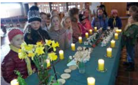
Speiderjenter på påskevandring.

- Programmet denne fredagen består av verk som er skrevet i denne tradisjonen, og selv om Vår Frelses kirke ikke er noen San Marco i Venezia, tror vi publikummet kan få et flott møte med denne musikken.