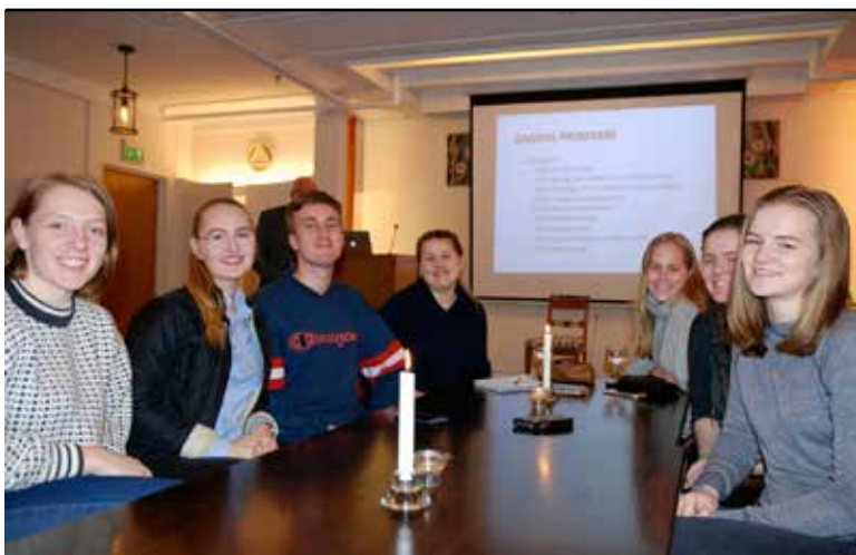
- Livssynsdialog er et fint tiltak, synes ungdommene som representerte kirken på dialogmøtet 14. mars.