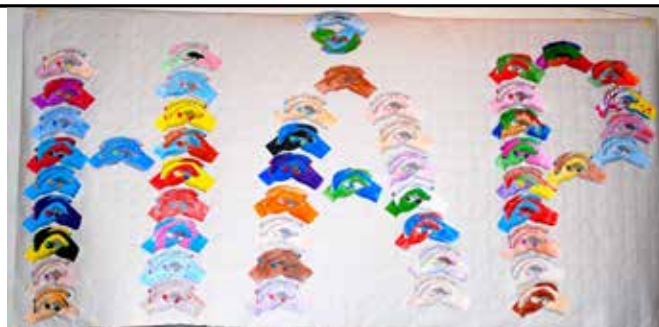
Til gudstjenesten laget konfirmantene dette HÅPs-bildet, satt sammen av tegninger av ulike foldede hender.

- At gravene er vendt mot øst, siden det står i Bibelen at Jesus skal komme igjen i øst. Og vi så på forskjellige symboler på gravene som