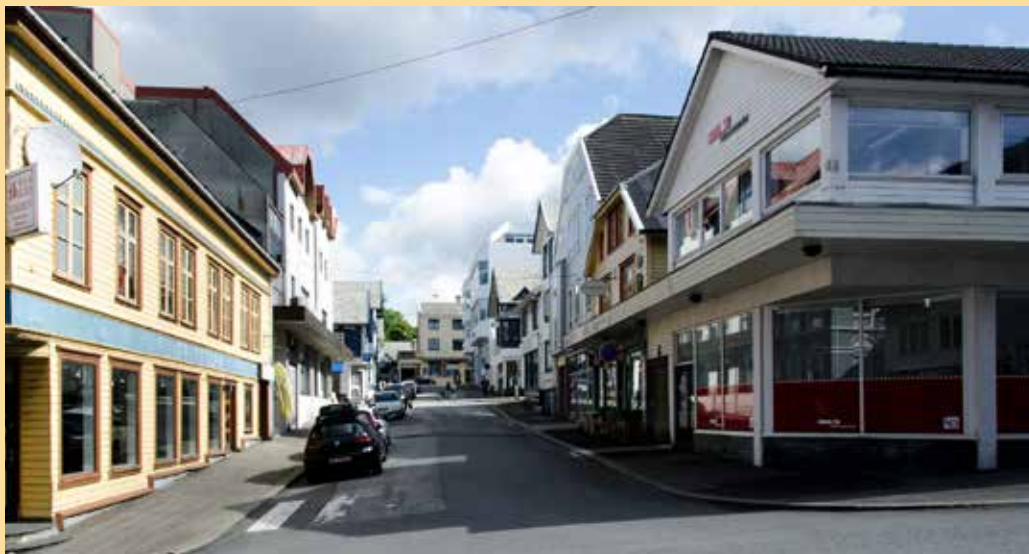
Niels Skorpens gate i dag. På hjørnet mot Strandgata, der Fellesforbundet nå har hus, hadde Niels Skorpen sin butikk.