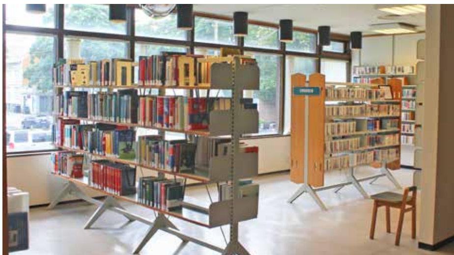
Her blir det sannsynligvis kafe, i det tidligere avisrommet.

Biblioteksjefen vet ennå ikke så mye konkret om parken, men er helt klart begeistret over ryktene om lekeapparater formet som bokstaver. Og navnet må vel bli «Bibliotekparken?»