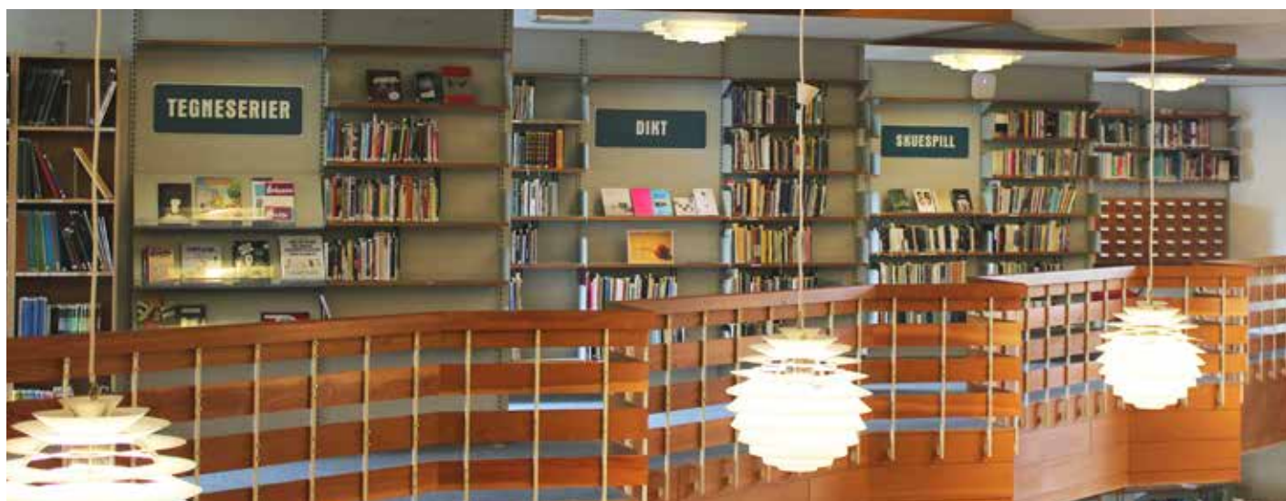
Original lysarmatur i taket og skilt i turkis farge.