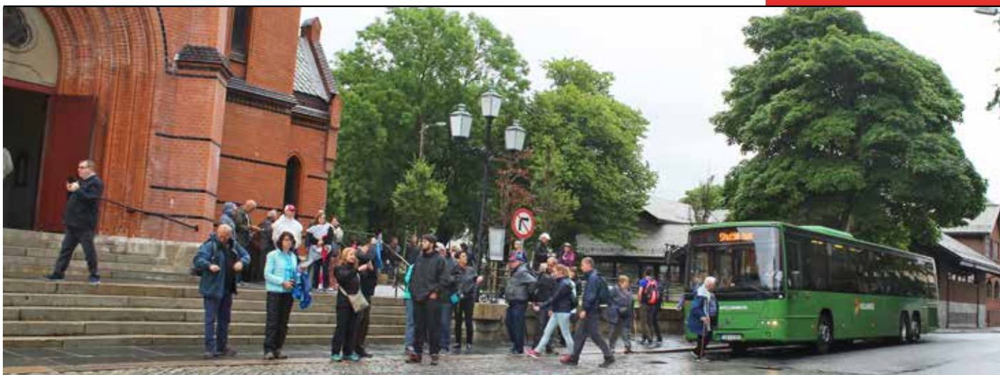
Cruiseturister utenfor Vår Frelser's kirke onsdag 2. august