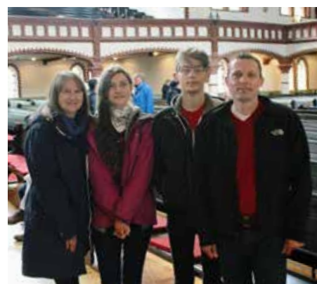
Familien Jones fra Maidenhead i England har vært innom mange kirker.

- Vi har åpent 3-4 timer ved så å si hvert cruise-