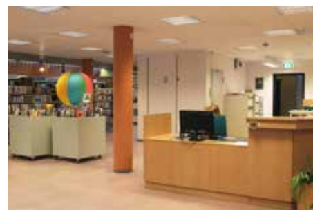
Her blir den nye skranken i første etasje.

- Hovedutlånet blir i brakkene oppe ved Flotmyr. Og så har vi avtalt med Gamle Slaktehuset at barneavdelingen blir i Småsalen,