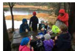
Spisepause ute i villmarken.

som et eneste stort smil når man leser om denne årvisse målingen, og slik er det jo ikke, slår han fast.