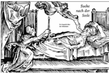
Middelalderen var sjelens glansperiode. Bildet er fra 1400-tallet

Det var også ulike forestillinger om hvordan den så ut. Det vanligste var å se den for seg som et lite menneske, et motiv en gjenfinder i kunsten helt til våre dager.