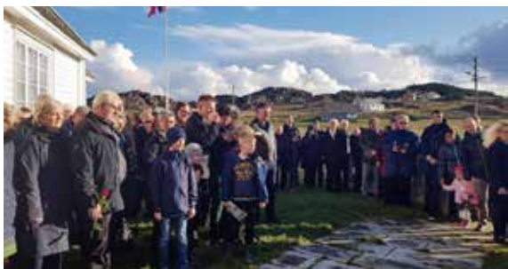
Mange overvar kransenedleggelsen etter gudstjenesten.