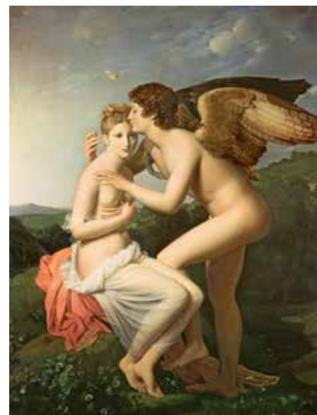
Amor og Psyche av Francois Gerard (1798). «Omsorg for sjelen» ble et favorittmotiv i kunsten allerede i senantikken.

- Så kom Aristoteles og opphevet kropp- og sjel-dualismen. Han anså sjelen som et livsprinsipp som gir alt form, og mente at sjelen skulle utvikles og nå fullkommen og ren form, sier professoren.