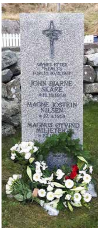
Minnestein for tre av de omkomne etter Emly-forliset. Fjerdemann ble funnet og har egen grav i Vedavågen.