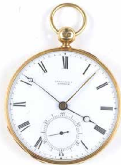
To minuttvisere. En britisk urmaker laget i 1847 dette lommeuret for reisebruk. På innsiden av lokket var det inngravert en oversikt over forskjellen mellom GMT (som jernbanen brukte) og lokaltid i en rekke byer. De to minuttviserne kunne stilles uavhengig av hverandre.