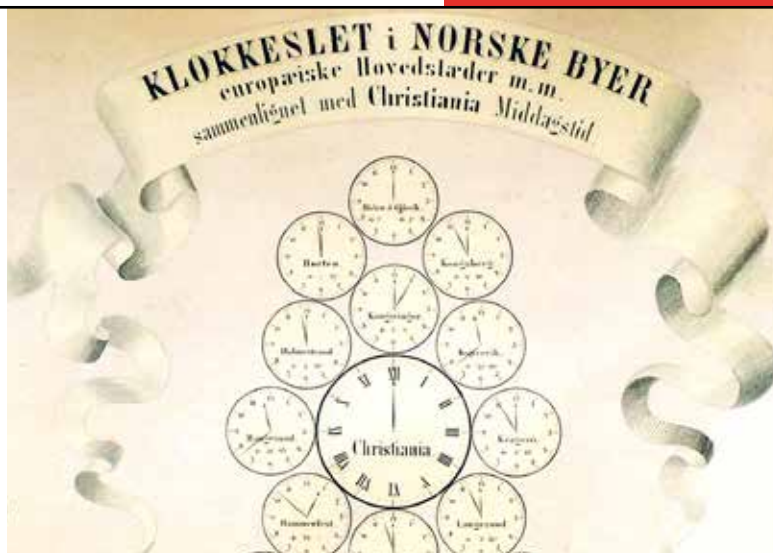
Norske tider. En plansje for å holde greie på alle lokaltidene kunne komme vel med. Når klokka var 12 i Christiania, var den bare to over halv i Haugesund.

Det var stappfullt på bedehuset. Mest arbeidsfolk. Ordskiftet var stormende og debattantene var hete og engasjerte. Det var den nye tiden det gjaldt.