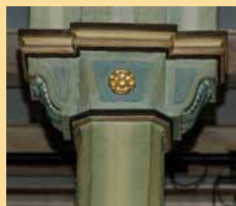
En rose av gull i Skåre kirke