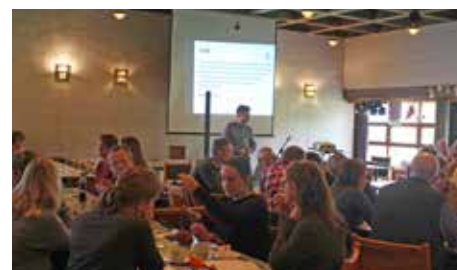
Det var Rossabø menighet som tok initiativ til fagdagen i Rossabø kirke. Her fra fore- lesningen, med Leer-Salvesen i bakgrunnen.

«Du jobber i kirken. En 15-årig gutt som du kjenner fra menighetsarbeidet ber om å få pra- te alene med deg. Han forteller at han er be- kymret for en navngitt kamerat. Kameraten har blitt stille og innesluttet den siste tiden, han dropper ofte treninger og møter ikke til avtaler. Gutten forteller også at kameraten har det vanskelig hjemme. Kameraten har flere ganger sett at faren har slått og sparket moren.