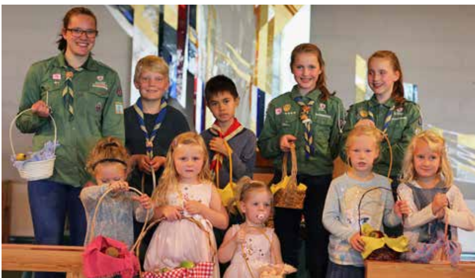
Speidere og barn som deltok på høsttakkefesten.