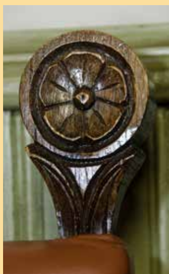
Fembladet rose på en stol i koret i Vår Frelsers.

I Skåre kirke finnes det symboler på bærebjalkene inne i selve kirkerommet. Høyt på søylene fremst i kirkeskipet finnes det roser, forgylt. Er det en Lutherrose? Den har fire kronblader, Lutherrosen har fem. Nære på.