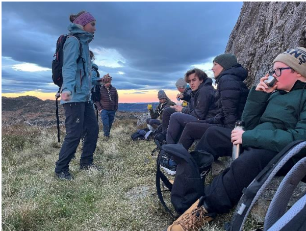
Vandrertur i Byheiene

Noen speidere deltok på Kampen om Vikingskipet på Bokn, familiefest for alle speidergruppene i Rossabø i november. Seks ledere deltok på kretsens ledersamling i Vats i november.