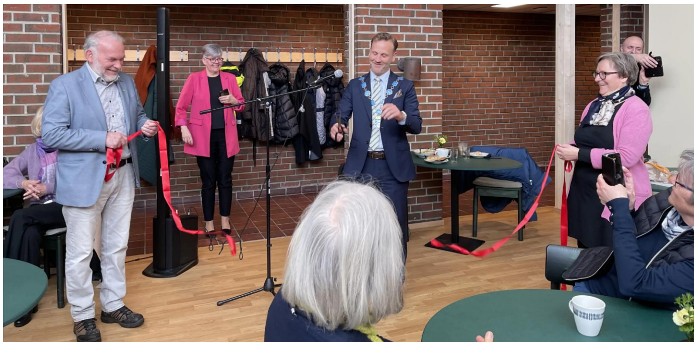
Åpning av «Bare hyggelig»-kaféen, Kirketorget og ombyggingen av Menighetshuset fredag 5. april 2024