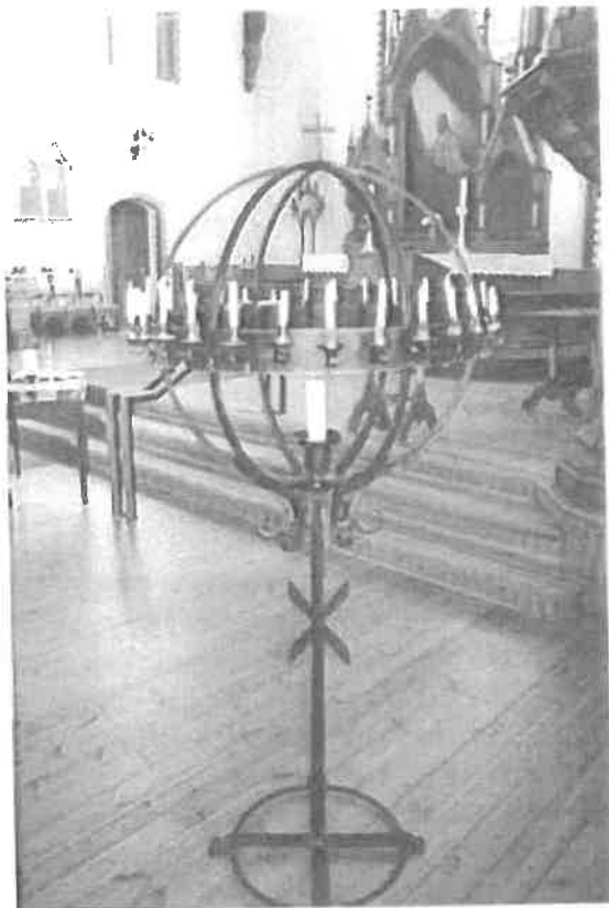
Bilde nr. 1.