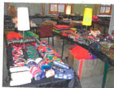
Salgsbord i menigheten