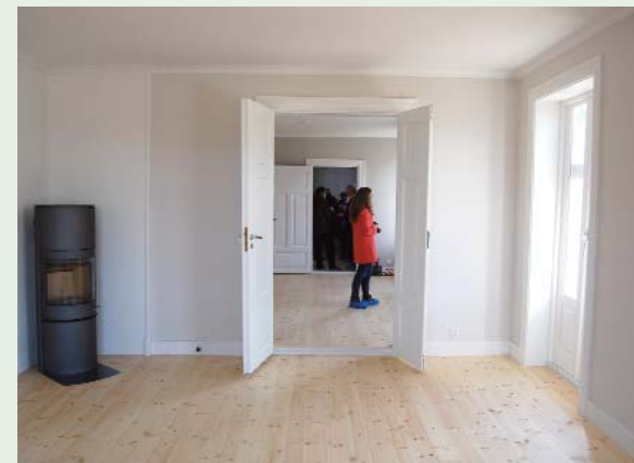
Prestegårdstuene fremstår lyse og delikate.