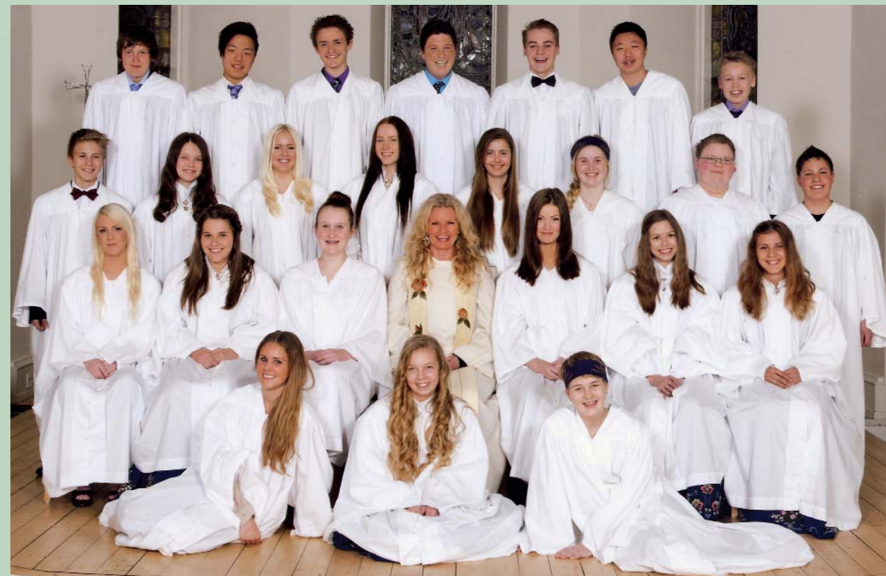
Konfirmantene i Spjærøy kirke