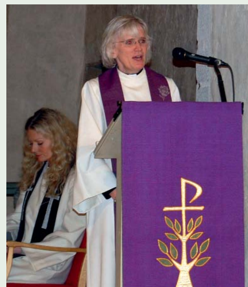
Den nye sognepresten for første gang.