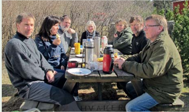
Dugnadsgjengen på prestegården.

Siden dette er arbeide på opplysningsvesenets Fonn sin eiendom får vi betaling med Kr 150 pr time og til nå utgjør dette ca Kr 10.000 til en slunken kasse i menigheten. Hvis flere vil være med på dugnaden er det bare å ringe Kirkens Hus og snakke med Ingrid Dean på telefon 69 37 90 37.