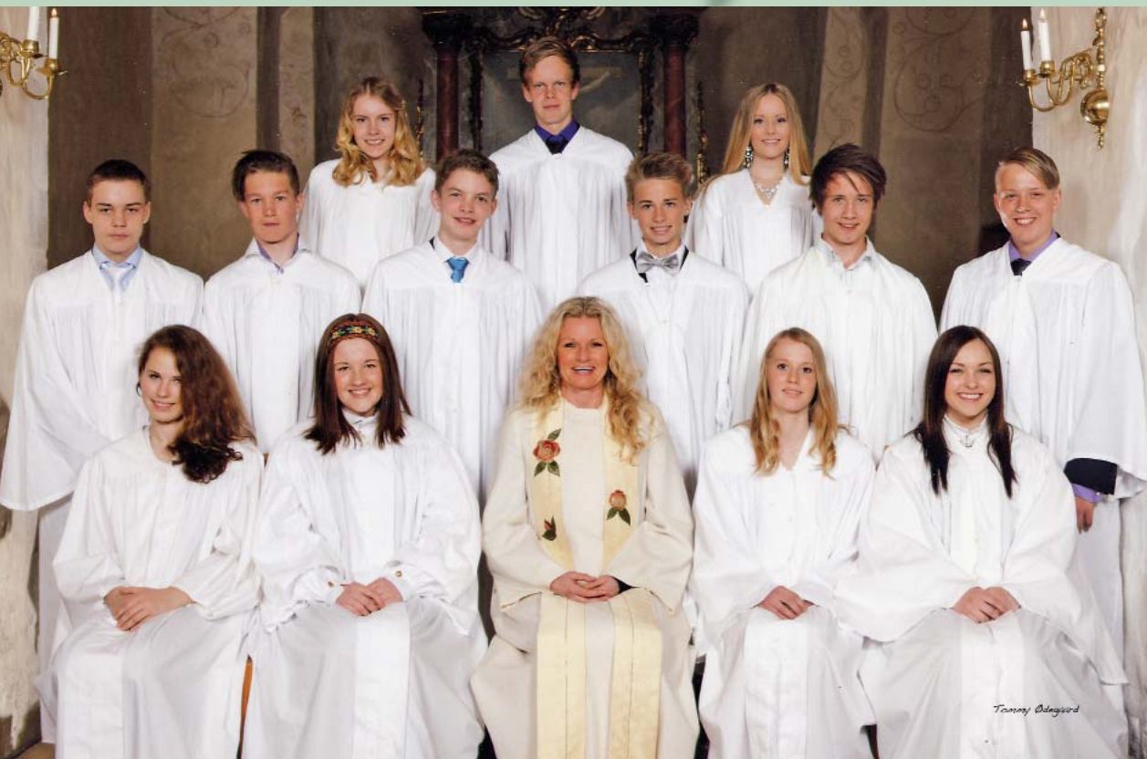
Konfirmantene i Hvaler kirke