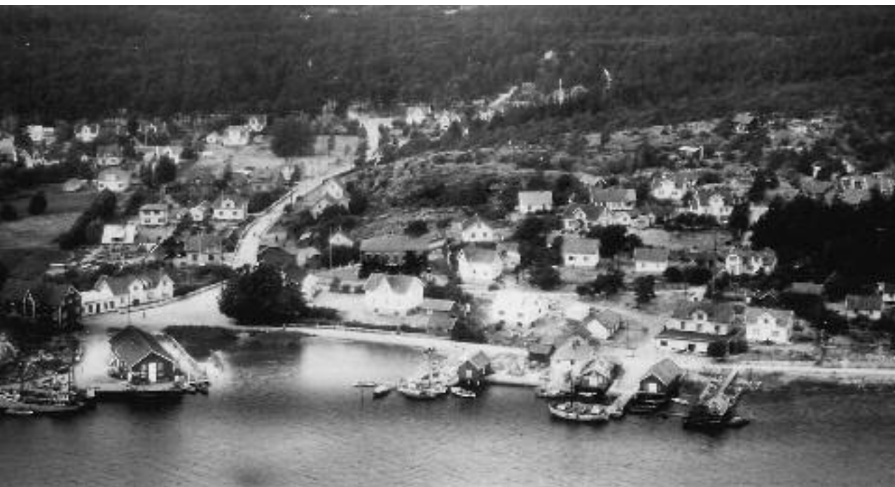
Her på Skjærhalden var det vanlig med utleieleiligheter på 50-og 60-tallet.

Kanskje det ville være hyggelig for den som tusler i underetasjen å høre små føtter løpe over gulvet. Kanskje det til og med kunne skape trygghet og litt hjelp til småting å ha noen unge, friske mennesker i huset? Jeg vet vi ikke trenger pengene ved å leie ut slik som før, inn-tekten og senere trygden sørger for det. Det er bare noen av tankene som surrer i mitt gamle hode. Selv er jeg nemlig så heldig at jeg bor slik, i halvparten av det som før var vårt hus.