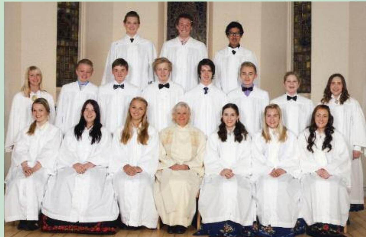
Konfirmantene i Spjærøy kirke