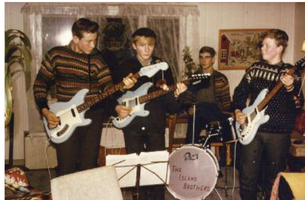
Det var vanlig å åpne hjemmet sitt for aktiviteter. Her øver "The Island brothers" i stua.

Det som er rart er at det ikke er bare ungdom vi er redd for å slippe inn. I mine foreldres omgangskrets var det vanlig at naboer og venner kom på besøk uten å være spesielt invitert. Foreninger av alle slag hadde møtene sine rundt i hjemmene og det var ikke fordi man ikke hadde forsamlingshus å være i, dem var det omtrent like mange av da som nå. Møtene gikk på omgang enten det var misjonsmøter, blindeforeninger, K.F.U.K eller hva som helst. I de små stuene ble det ryddet plass. Da jeg var med i yngre Saniteten var det møter hjemme hos hverandre. Ja, jeg har til og med opplevd