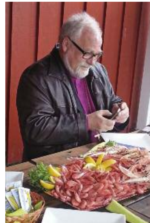
Biskopen i Hvalermiljøet.

skyer og regn, men desto bedre var oppvarmingen følget fikk vel framme på fiskemottaket i Utgårdskilen med nykokt krepser og reker. Videre gikk turen innom Dypedalsåsen hvor biskopen holdt andakt. Omvisning på Kystmuseet og i