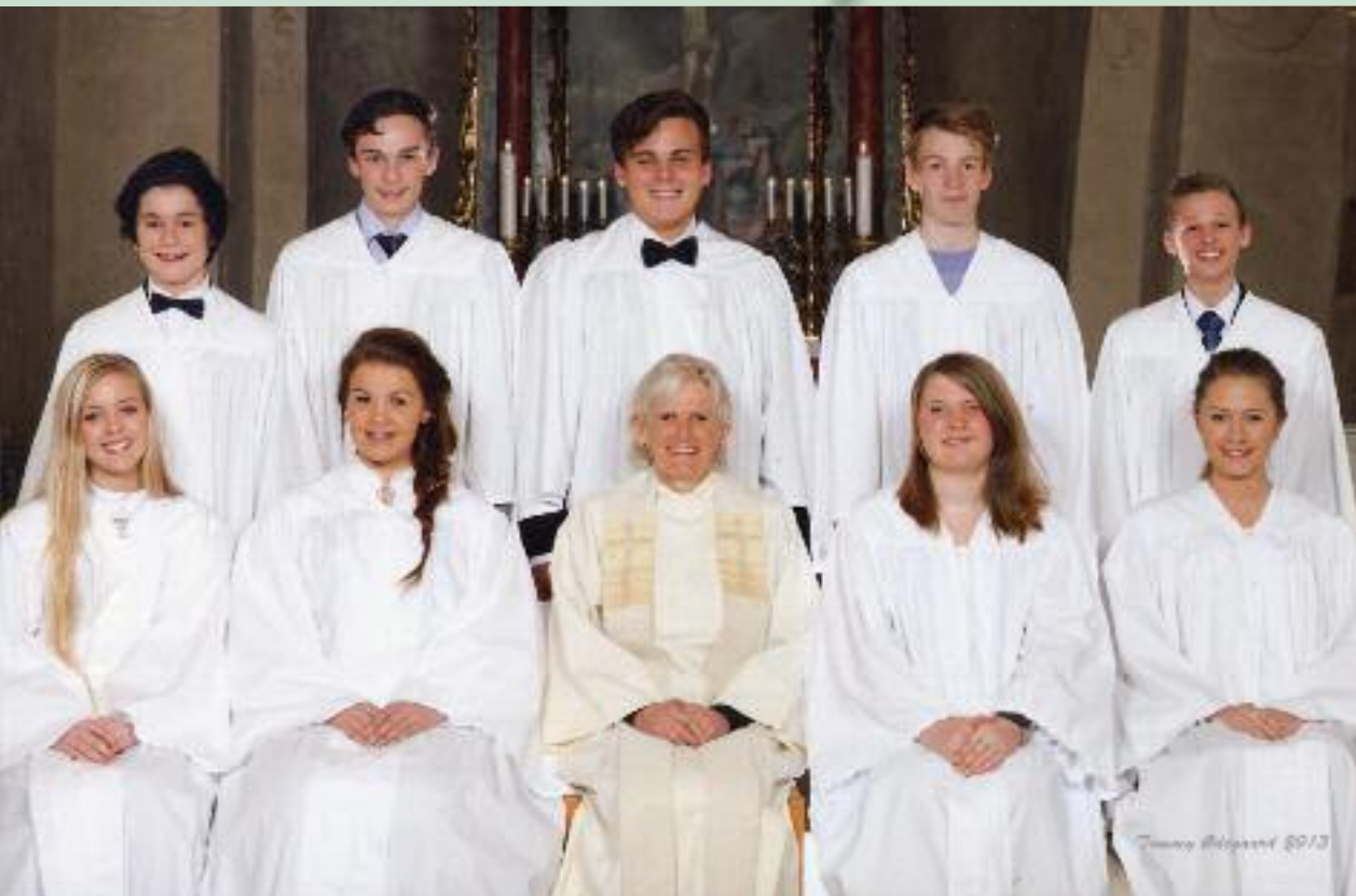
Konfirmantene i Hvaler kirke