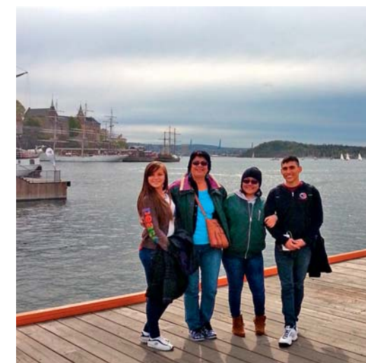
På besøk i Oslo. Bildet er tatt på Aker Brygge