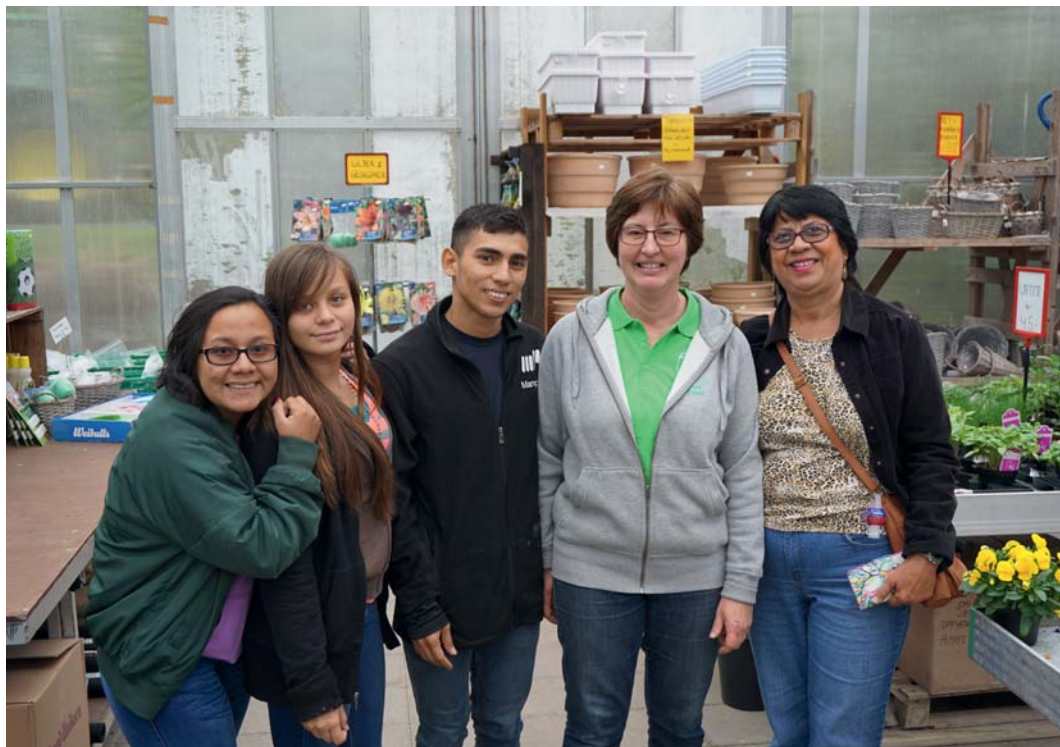
Besøk på Botne gartneri

Hvaler kommune er vennskapskommune med Zacapa i Guatemala. Det var FN som henvendte seg til verdens kommuner i 1992 og oppfordret disse til å utvikle slike vennskapsbånd. Hensikten med ideen var å bidra til kulturell og sosial utveksling, noe som igjen skulle skape mellommenneskelig interesse og forståelse.