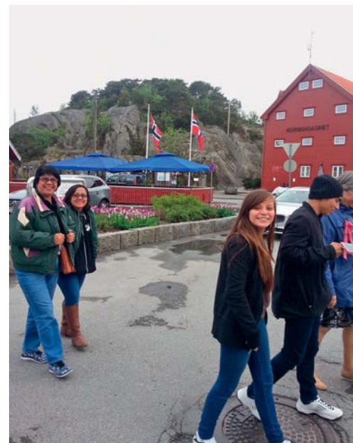
På Skjærhalden torv

12. mai reiste tre av oss til Gardemoen med kommunens minibuss for å ta imot gjestene. Vi møtte fire glade og spente guatemalanere, og vi var ikke noe mindre glade og spente vi heller.