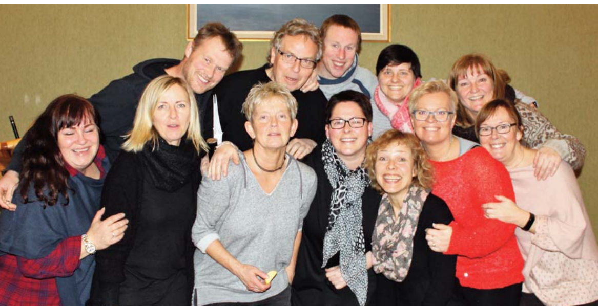
Prosjektkoret Himmel og Hav

Konserten har altså fri adgang, men det er lov å gi en gave på veien ut – til inntekt for Hvaler menighet.