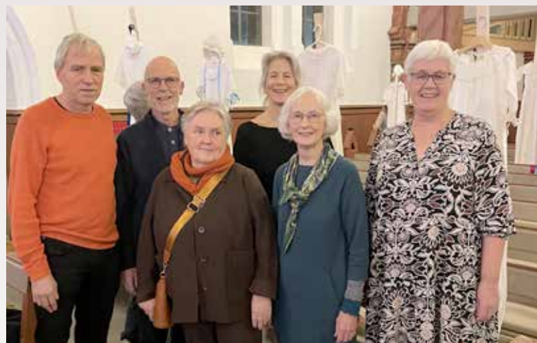
Arbeidsgruppa har lagt ned et stort arbeid.