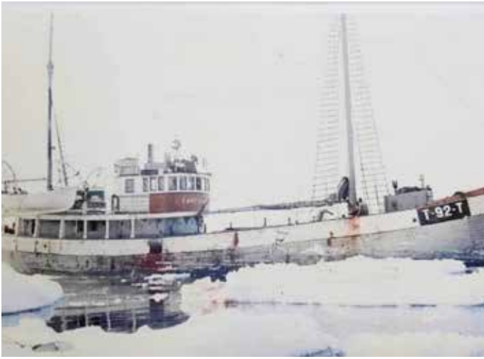
Fortuna, en ishavsskøyte ført av en myndig ishavsskipper av den gode gamle skole.