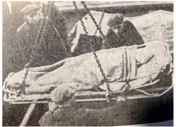
Et 80 år gammelt bilde som vekker sterke følelser. Gamle syke heises om bord i Staværingen i Trondheim. Datoen er 11. november 1944. Det gjenstår nå bare en times reise – til Stadsbygd.