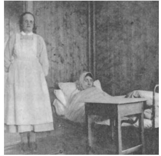
Tatt like før krigen. Mange var sengeliggende. Så kom evakueringsordren.