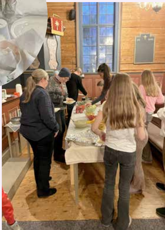
God oppslutning om tacokvelden

Rissa felles menighetsråd hadde møte 16. oktober. I dette møtet vedtok vi menighetsrådets budsjett for 2025 og gudstjenesteplanen for 2025. Vi oppnevnte folk som skal sitte i arbeidsgruppa for Misjon i hagen 2025, som vi arrangerer sammen med Det norske misjonsselskap, NMS.