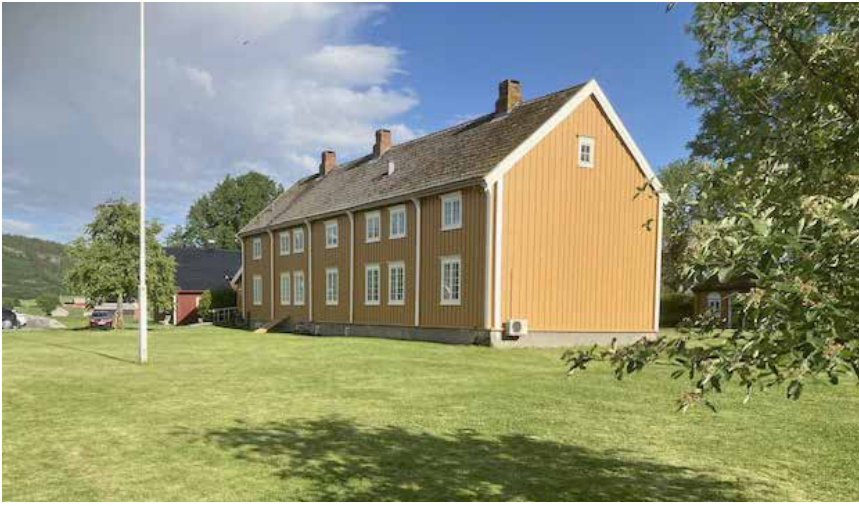
Stadsbygd prestegård en sommerdag i 2024.