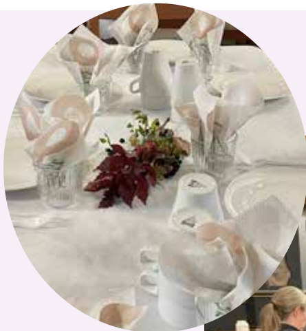
Klar for taco i kirka