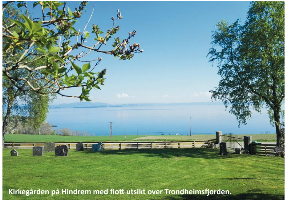
Kirkegården på Hindrem med flott utsikt over Trondheimsfjorden.

Kirkegårdsarbeidet er et noe mer synlig arbeid for de som besøker kirkegården, spesielt på denne årstiden når gresset vokser og det forventes at dette er i en rimelig passe lengde. Dette kan det være noe vanskelig å rekke å holde i orden enkelte ganger da det av og til kommer begravelser som må prioriteres, og da sier det seg selv at det er fort gjort å komme noe på etterskudd da det er noe over 90 dekar som skal klippes og holdes i orden. Busker, trær og annen