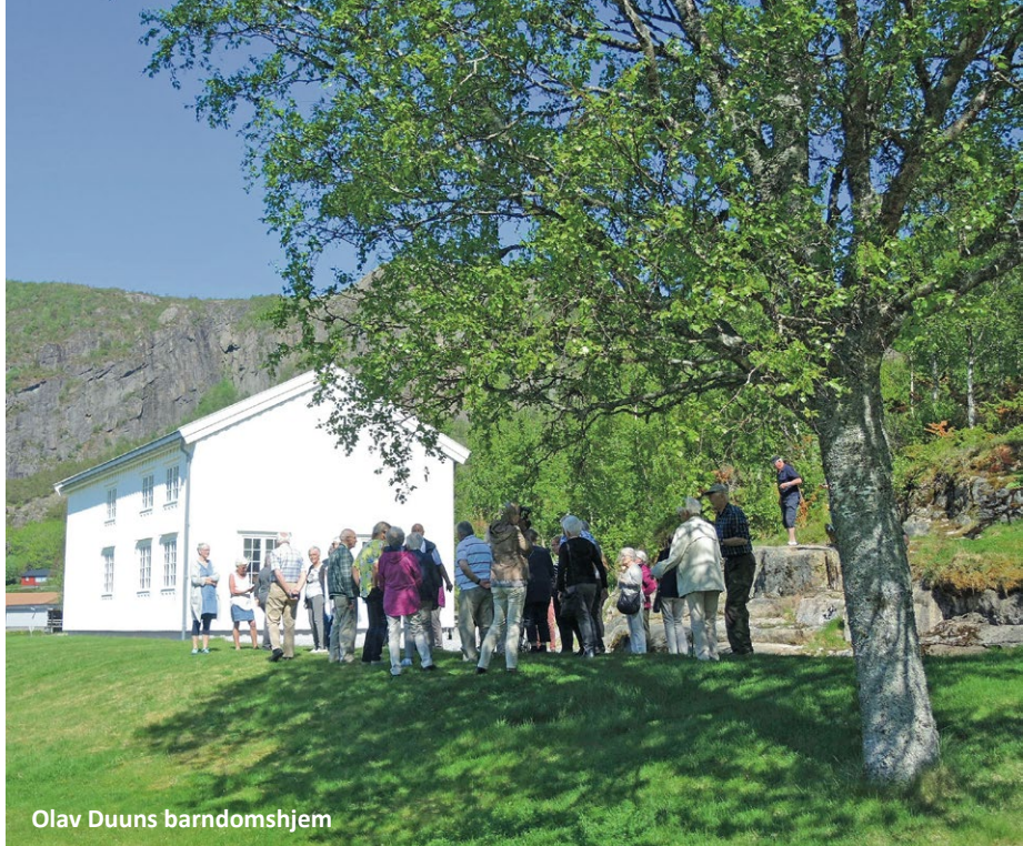
Olav Duuns barndomshjem