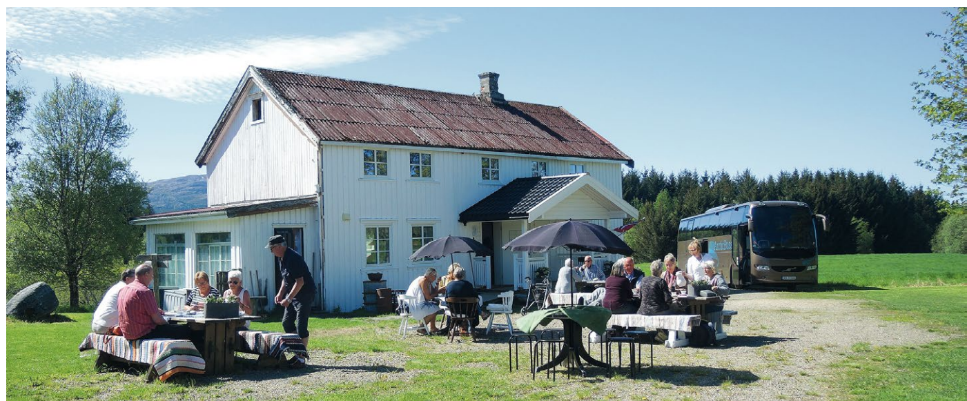
God service og lunsj i trivelig lag på en solfylt dag ved Dalheimen Gjestehus på Jøa.