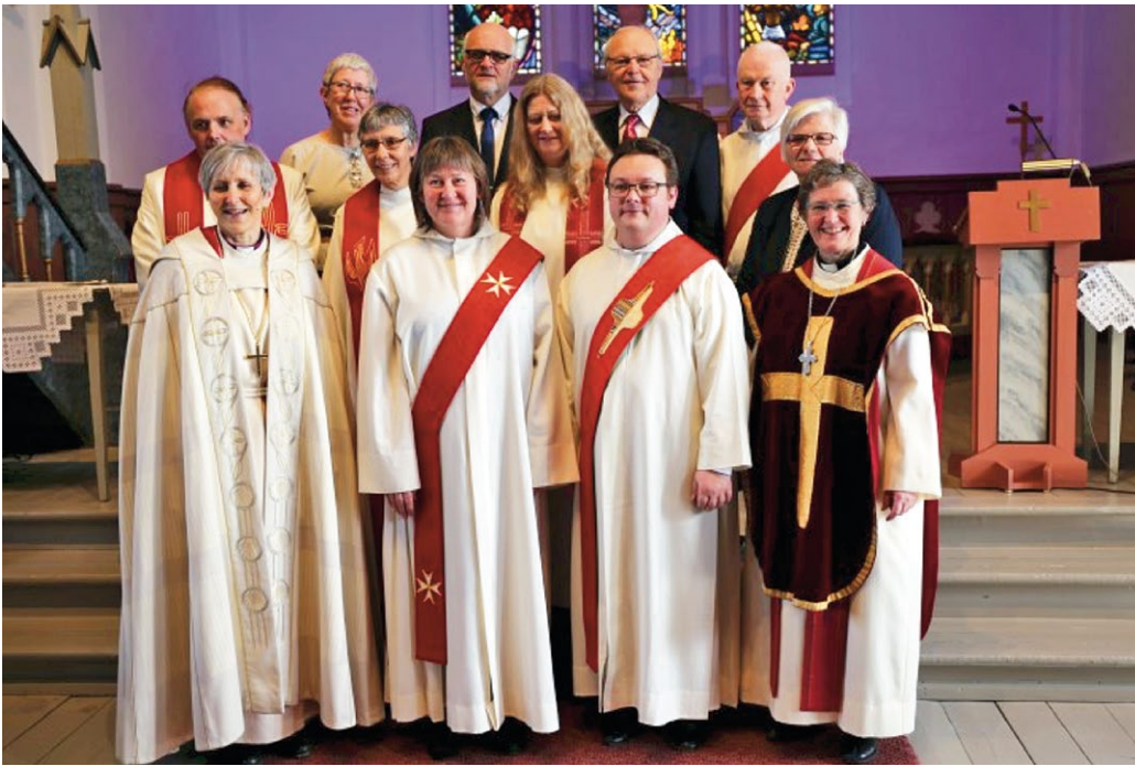
Medvirkende under vigslingsgudstjenesten i Rissa kirke.