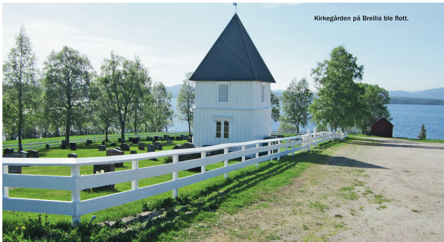
Kirkegården på Breilia ble flott.