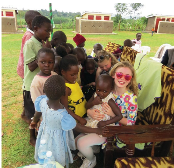
Ikke noe å si på kontakten.