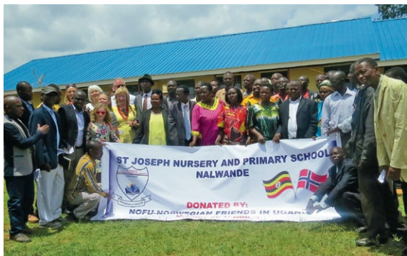
Skolen er offisielt åpna!