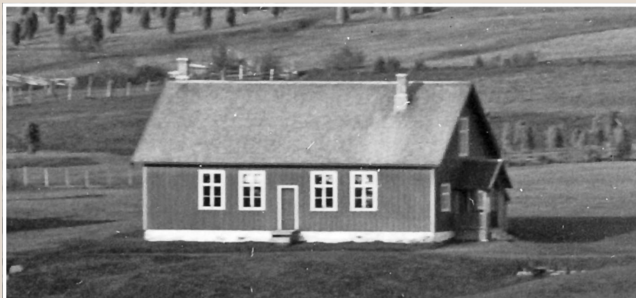
Dette er et utsnitt av et større bilde. Bilde er tatt ca. 1910 og viser Forsamlingshusets opprinnelige størrelse og utforming.