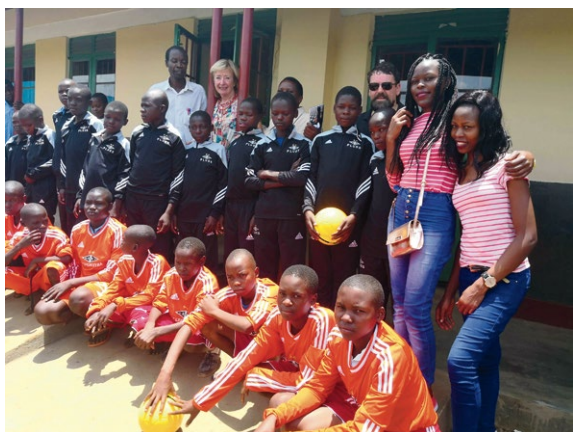
Ungene i sportsklærne de fikk.