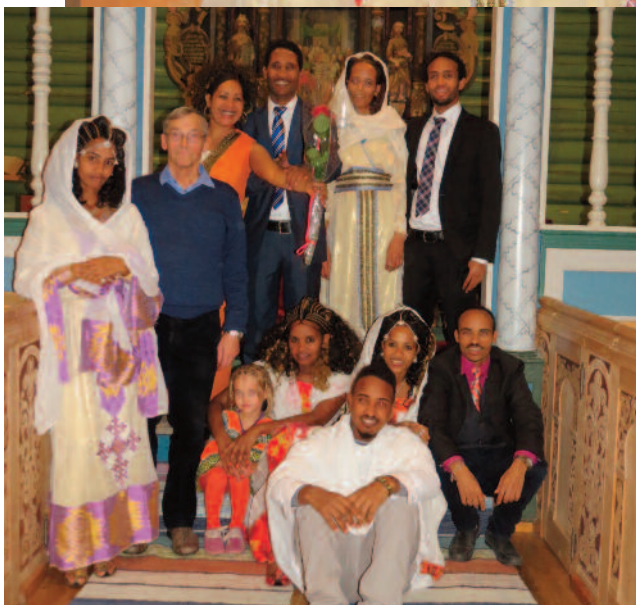
Barn og voksne hadde en trivelig kveld sammen .