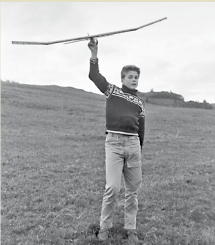
I tillegg til naturen og dyrelivet, var det fotografering og modellfly som opptok oss mest.