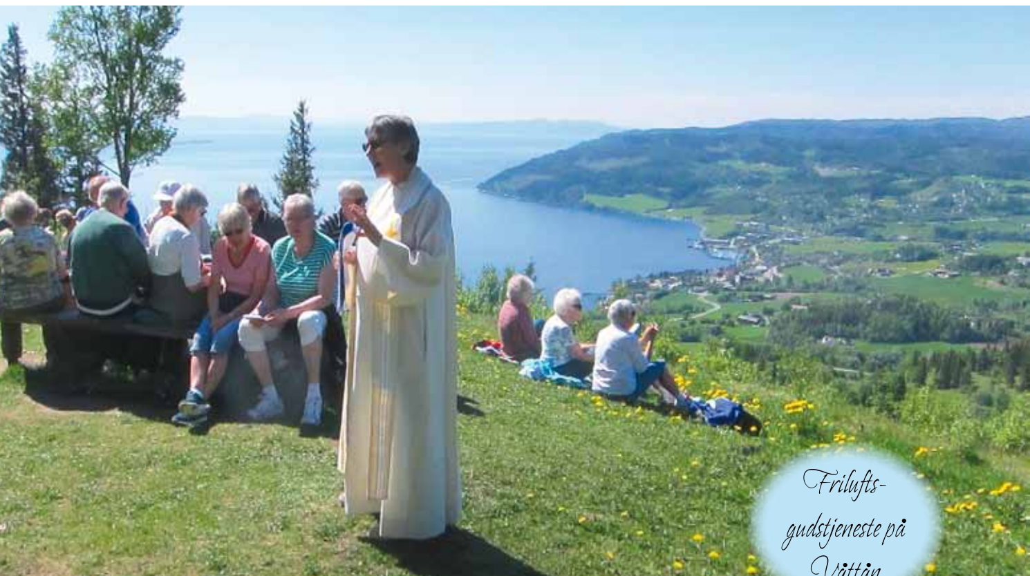
Friluftsgudstjeneste på Vättån