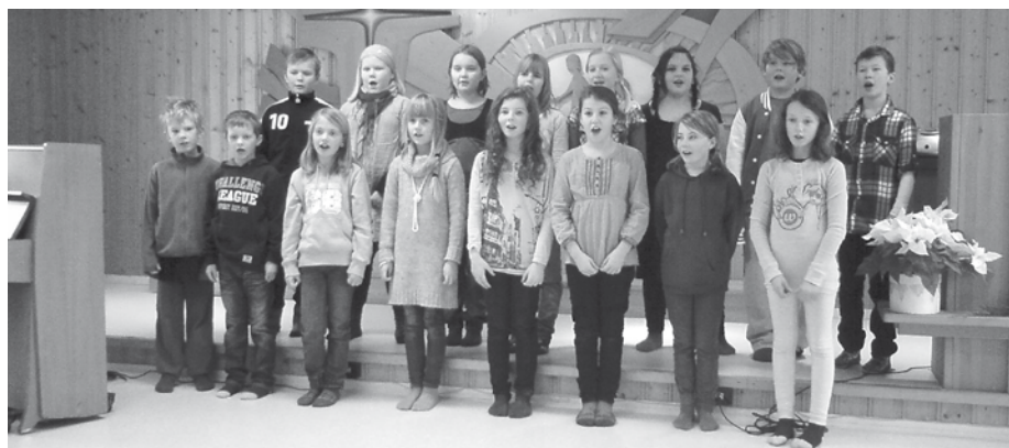
En trivelig gjeng med 4.klassinger fra Vanvikan skole underholdt på hyggeetreffet i januar. Det var kjempekoselig og de var kjempeflinke. Takk for besøket!