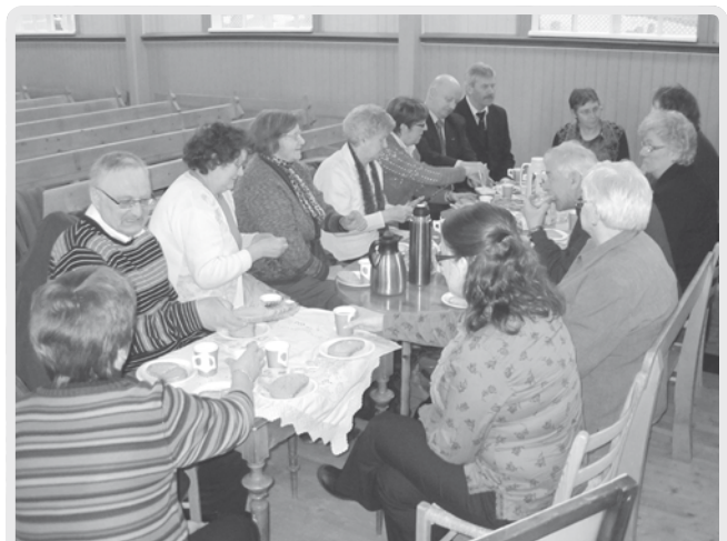
Etter kveldsgudstjenesten i Stranda kirke skjærtorsdag ble de tilstedeværende invitert til kveldsmat i kirken.

Leksvik kirke kl 11.00. Utdeling av 4-årsbok, høsttakkefest.