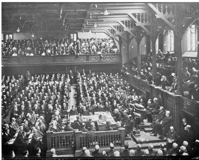
Fra misjonskonferansen i Edinburgh i 1910.

I juni i år ble det avholdt en ny konferanse i Edinburgh – Edinburgh 2010.