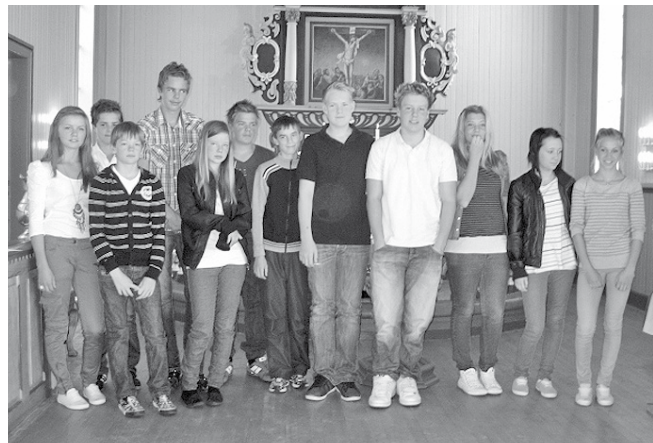
Søndag 5. september ble ”årets konfirmanter” presentert i Stranda kirke. En flott gjeng med ungdommer som blir konfirmert våren 2011.

Tradisjonell julekonsert med lokale aktører i Leksvik kirke kl 19.00.