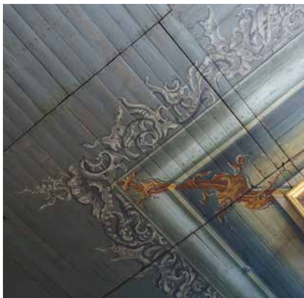
Parti i taket av den kraftige gesimsen. Malt av Eric-Gustaf Tunmarck.