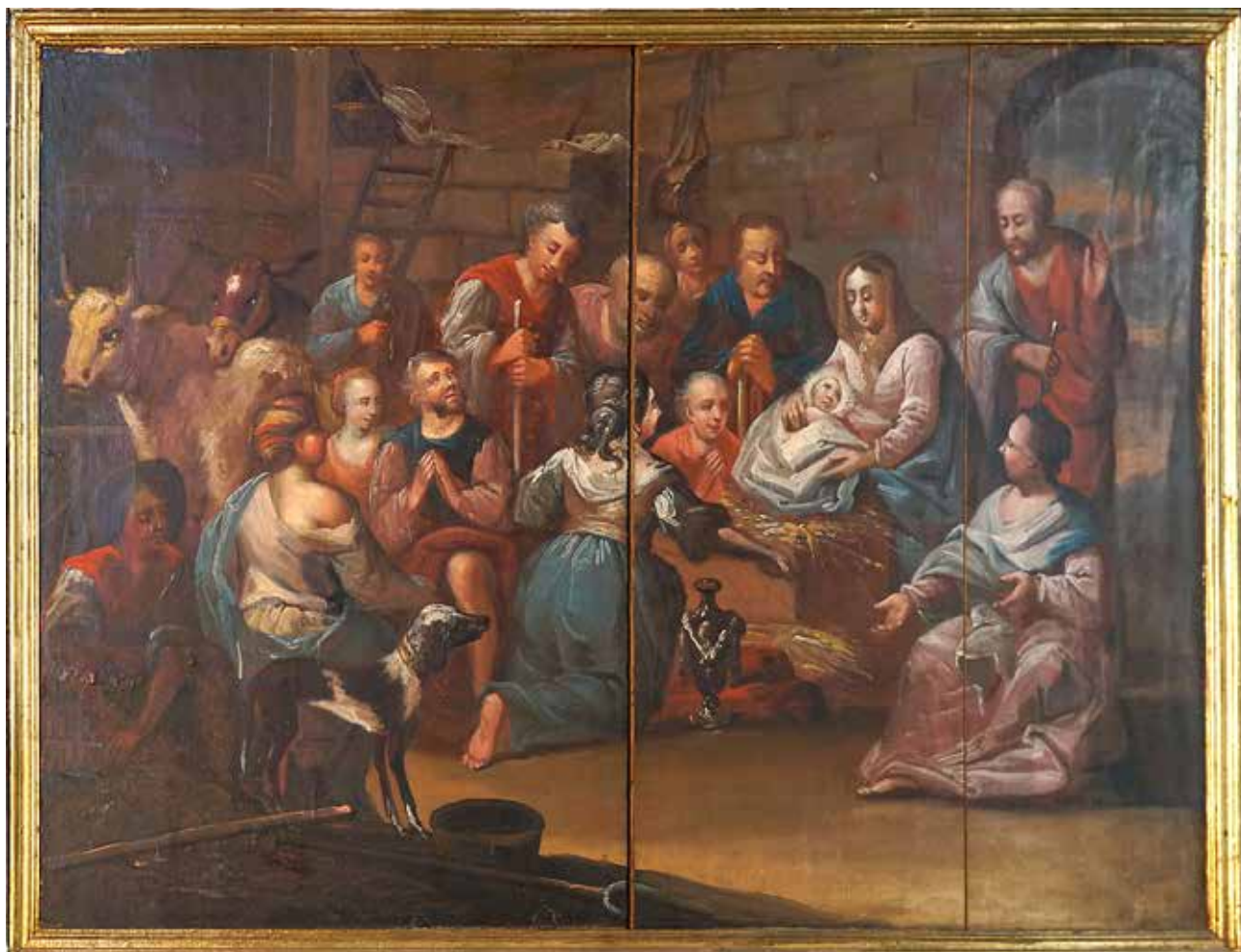
Jesus blir født (på Brudelosjen)

Med ett var engelen omgitt av en himmelsk hærskare, som lovpriste Gud og sang: ”Ære være Gud i det høyeste, og fred på jorden blant mennesker Gud har glede i!” Da englene hadde forlatt dem og vendt tilbake til himmelen, sa gjeterne til hverandre: ”La oss gå inn til Betlehem for å se dette som har hendt, og som Herren har kunngjort for oss.” Og de skyndte seg av sted og fant Maria og Josef og det lille barnet som lå i krybben. Da de fikk se ham, fortalte de alt som var blitt sagt dem om dette barnet. Alle som hørte på, undret seg over det gjeterne fortalte. Men Maria tok vare på alt som ble sagt, og grunnet på det i sitt hjerte. Gjeterne dro tilbake. De lovet og priste Gud for alt de hadde hørt og sett; alt var slik som det var sagt dem.” (Lukas 2, 1-20)