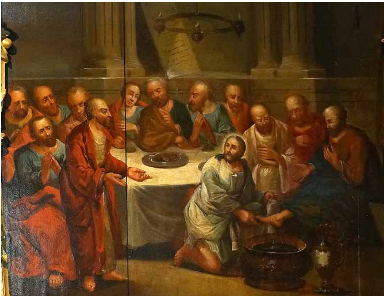
Fotvaskingen (på nordsiden av alterveggen)

Da han hadde vasket føttene deres og tatt på seg kappen, tok han plass ved bordet igjen. Så sa han til dem: ”Forstår dere hva jeg har gjort for dere? Dere kaller meg mester og herre, og dere gjør det med rette, for jeg er det. Når jeg er herren og mesteren, og har vasket deres føtter, da skylder også dere å vaske hverandres føtter. Jeg har gitt dere et forbilde: Slik jeg har gjort mot dere, skal også dere gjøre. Sannelig, sannelig, jeg sier dere: Tjeneren er ikke større enn herren sin, og utsendingen er ikke større enn han som har sendt ham. Nå vet dere dette. Og salige er dere så sant dere også gjør det.” (Johannes 13, 1-17)