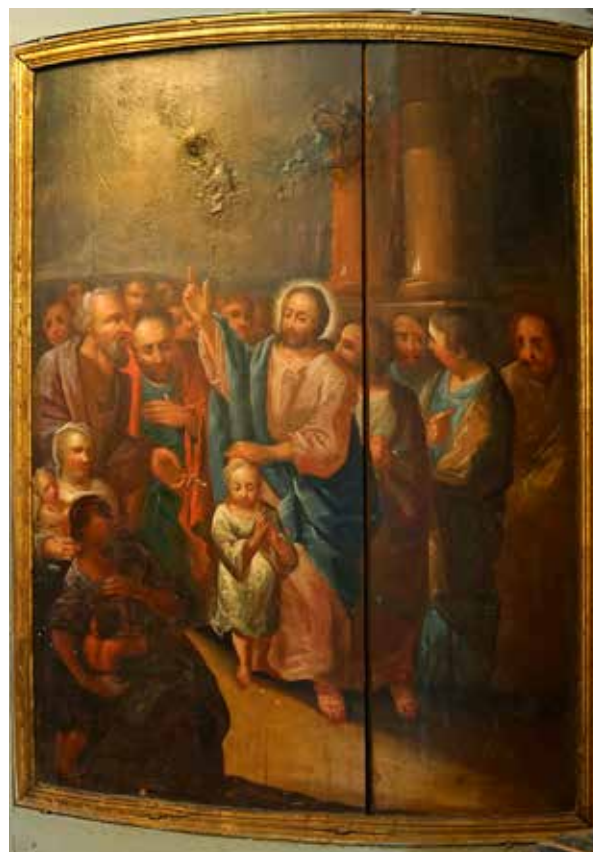
Jesus og barna (nederst ved gulvet)

Barn hadde en helt annen status i samfunnet den gangen enn de har i dag. Samfunnsmessig var barn i antikken svært utsatt og sårbare. Det var perioder der en fjerdedel av alle barn døde i løpet av det første leveåret, og nesten halvparten før de var ti år. Den gangen hadde de vel ikke innsikt i hvordan barn tenker. Men det de visste noe om, det var hvordan voksne tenkte om barna og deres lave posisjon. Derfor var det så sjokkerende at Jesus ba dem om å bli som barn. Det innebar å innta en posisjon uten noen form for status eller makt. Det innebar å bli en som ikke har noe som helst å vise til eller bidra til noe i samfunnet. Barne-stadiet var nemlig et nødvendig onde på veien til å bli et tenkende menneske. I antikkens filosofi ble barna sett på som ufullstendige vesener, halvveis mennesker, på linje med slaver og barbarer. Noen filosofer sammenlignet barna med dyr som skulle temmes for å bli hele mennesker. Og det å kalle en voksen mann for gutt eller barn var fornærmende. Inn i denne situasjonen og med disse assosiasjonene er det altså at Jesus henter fram et barn og setter det i sentrum. Og ikke bare det, han sier til og med at den som ikke blir som dette barnet, ikke kommer inn i himmelriket. For disiplene var nok dette sjokkerende.