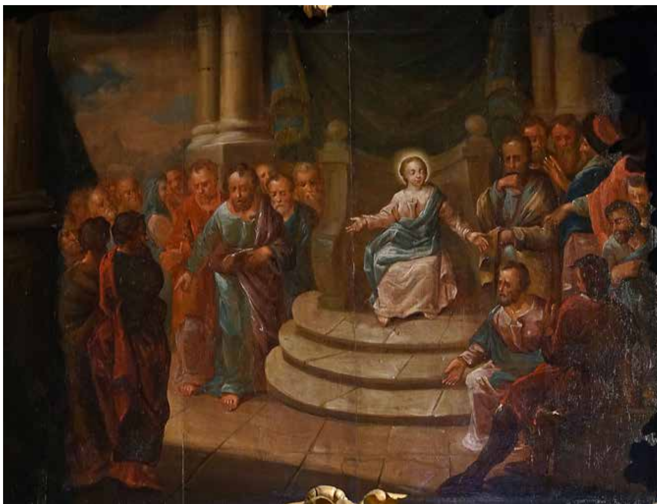
Jesus som barn i tempelet (på alterveggen, mot nord)

Så ble han med hjem til Nasaret og var lydlig mot dem. Men hans mor tok vare på alt dette i sitt hjerte. Og Jesus gikk fram i alder og visdom. Han var til glede for Gud og mennesker.” (Lukas 2, 41-52)