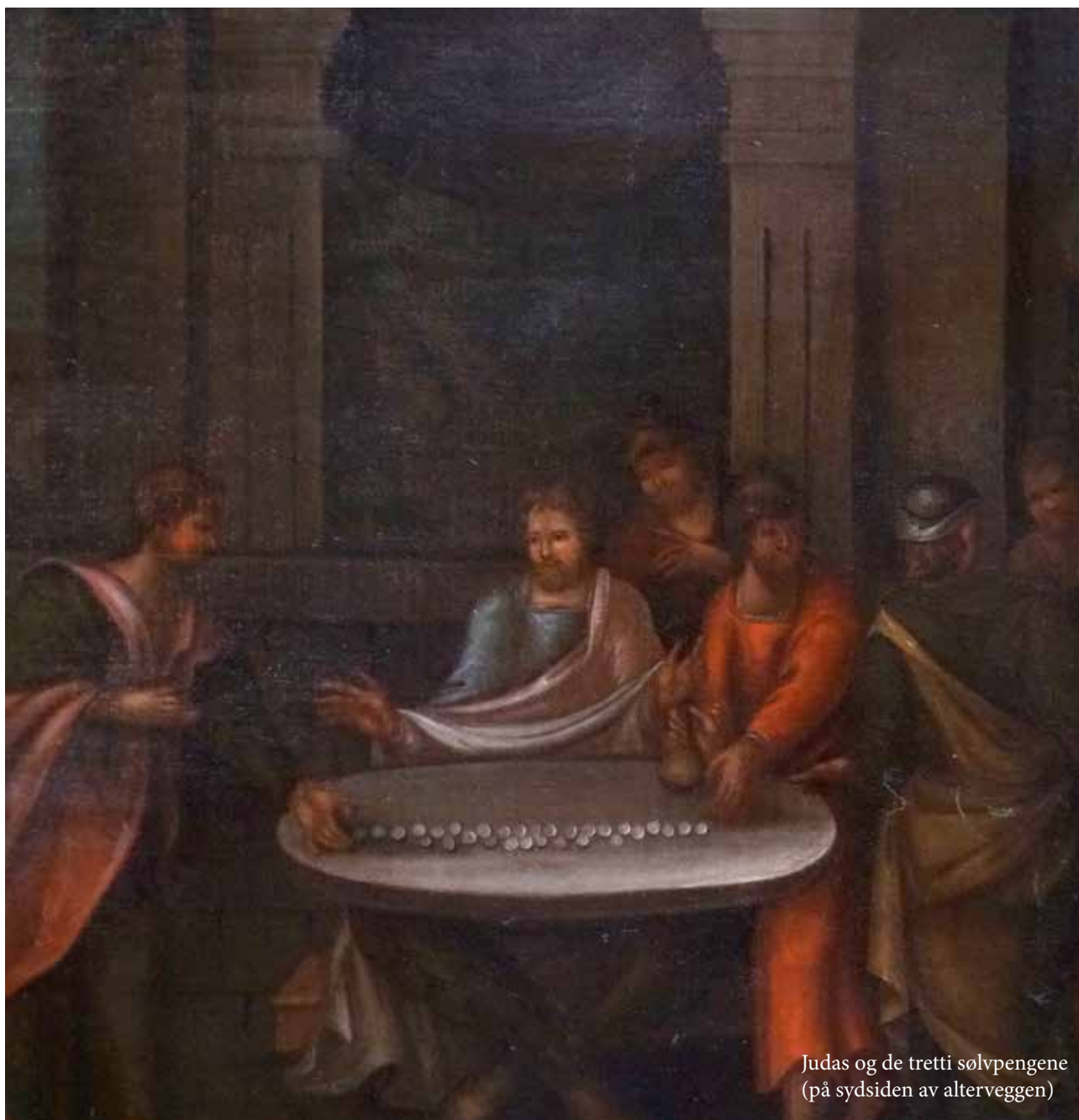
Judas og de tretti sølvpengene (på sydsiden av alterveggen)

Slik ble det ordet oppfylt som er talt gjennom profeten Jeremia: «De tok tretti sølvstykker, den pris han ble verdsatt til, han som Israels barn lot verdsette; og de ga dem for pottemakerens åker, slik som Herren påla meg.» (Matt. 27, 1-10)