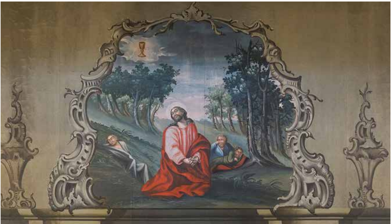
(over utgangen mot syd)

”Da de kom til et sted som heter Getsemane, sa han til disiplene:” Sett dere her mens jeg ber!” Så tok han med seg Peter, Jakob og Johannes. Han ble grepet av angst og gru, og han sa til dem: ”Min sjel er tynget til døden av sorg. Bli her og våk!” Han gikk fram et lite stykke, kastet seg til jorden og ba om at timen måtte gå ham forbi, om det var mulig. Han sa: ”Abba, Far! Alt er mulig for deg. Ta dette begeret fra meg! Men ikke som jeg vil, bare som du vil.” Da han kom tilbake og fant dem sovende, sa han til Peter: ” Simon, sover du? Klarte du ikke å våke en eneste time? Våk og be om at dere ikke må falle i fristelse! Ånden er villig, men kroppen er svak.” Igjen gikk han bort og ba med samme ord. Da han kom tilbake, fant han dem igjen sovende, for øynene deres var tunge av søvn. Og de visste ikke hva de skulle svare ham. Han kom til dem for tredje gang og sa:” Dere sover og hviler fremdeles. Nå er det avgjort. Timen er kommet. Menneskesønnen skal overgis i synderes hender! Han som forråder meg er nær.” (Markus 14, 32-42)