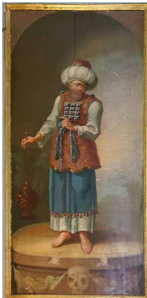
Aron (øverst på Kongestolveggen)

Når Aron skulle gå inn i helligdommen, skulle han ved sitt hjerte bære Jakobssønnenes navn på brystduken for dømsavgjørelser. På maleriet av Aron ser vi nederst et dødningehode. I barokken var dette mye brukt, og kalles Memento Mori . Dødningehodet under føttene på Moses og Aron henspiller på en latinsk frase: ” Memento Mori ”. Dette sa slaven til seierherren da han ankom i triumftog til Forum Romanum i Roma. Det betyr: ”Jeg minner om at du skal dø.” Slaven stod bak på vogna til triumfatoren, og han hadde to oppgaver: Å holde seierskransen over hodet hans og stadig minne ham på, at selv om han var seierherre i dag, ventet en ny dag i morgen. Slaven gjorde dette ved å minne seierherren om at han var dødelig ved å hviske: ” Memento Mori ” i øret på ham.