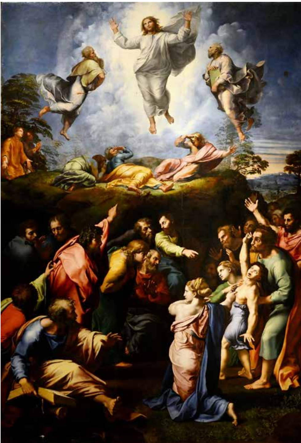
”Transfigurasjonen” (Forklarelsen på berget) malt av Rafael i 1520.

Rafaels siste altertavle, ” Forklarelsen på berget,” ble ikke ferdig, men ble avsluttet av assistenten Giulio Romano. Rafael døde på sin fødselsdag 6. april i året 1520. Begravelsen ble holdt i Vatikanet med den store, uferdige altertavlen foran kisten. ”Forklarelsen på berget” er mye brukt som motiv i den ortodokse ikontradisjonen.