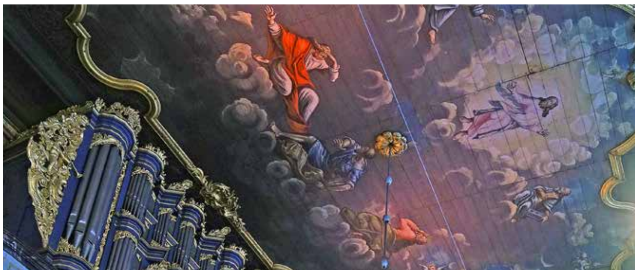
Legenden om apostelen St. Jakob (i takmaleriet, under Jesus)