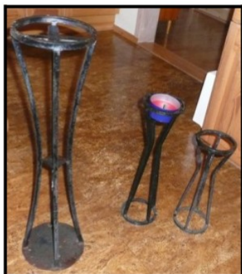
Fakkelsstativene som fikk 2. premie fra Hedmark håndverksbedrift. Designet av første års elever ved Sentrum

En gang hadde han elever på grunnkurset som designet fakkelsstativ. Disse ble laget i flere størrelser som bildet under viser.