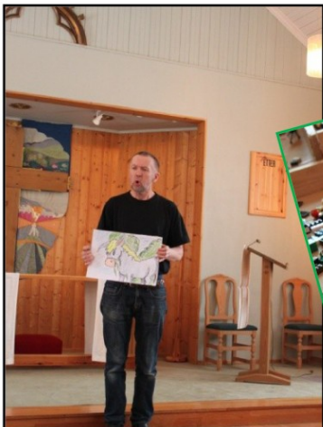
Trygve forteller om eselet som Jesus red inn i Jerusalem før påske, Eddi Esel

Onsdager kl 12.30 – 16.00 i Roverud kirke og på Hokåsen bedehus.