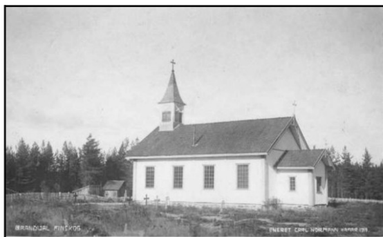
Lundersæter kapell med takrytter (saltårn)

Det var gravplass ved Lundersæter kirke ei stund før det kom kirkebygg. Kirkegården ble anlagt på furukollen sør for oppkjørselen til kirka i 1851. Ingen gravminner er synlige lenger, men området er ryddet og holdt pent. Området gikk ut av bruk i 1868, da kapellet ble oppført.