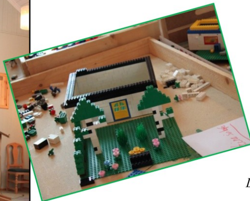
Legobilde – Starten på en fin villa.