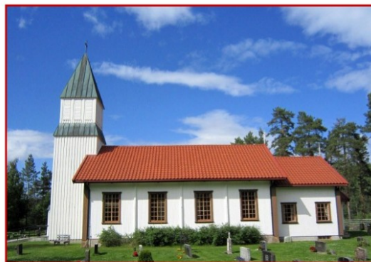
Lundersæter kirke med tårn fra 1954.

I 1954 ble vesttårnet bygget og tårnfooten ble innredet som våpenhus. Ola B. Aasnes var arkitekt for tårnet, og byggmester var Mentz Sæter.