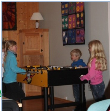
Dyp konsentrasjon om fotballspill