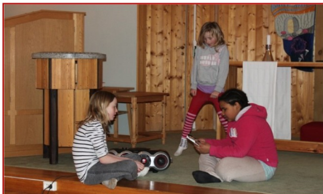
Sangbilde: Det gjelder å finne en sang vi kan synge, og øve litt.