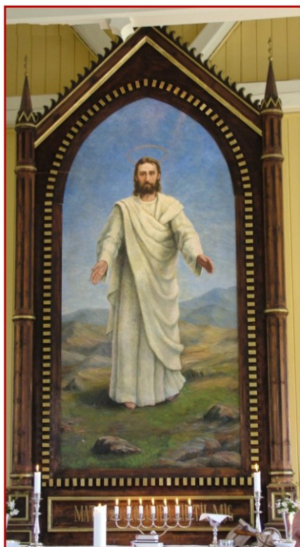
Altertavla malt av Valborg Luth.

konturer av fjell i bakgrunnen. Kristus-skikkelsen virker ungdommelig og frisk, og fargene er lyse, rene og sterke. Prekestolen er på alder med kirka og har fem fyllinger uten bilder.