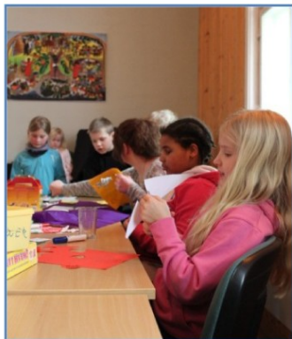
Det ble laget mange fin kort.