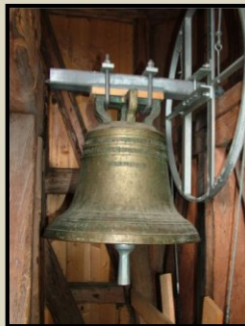
Kirkeklokka fra 1856

«I 1856 ble den minste klokka fra 1716 byttet ut med en ny, eller helst støpt om. På den nye minste klokka står det skrevet: STØBT AF OVE SKIERBAK I ELVERUM AF BRANDVOLDS MENIGHED BEKOSTED AAR 1856». Sitat fra Erik Svenke Solums bok Guds Aasyns Kirke .