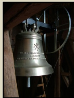
Kirkeklokka fra 1986.

Det ble også montert kirke-slag-apparat. Kostnad for klokke og arbeid ble kr 81 000. På klokka kan vi lese: Hellig, hellig, hellig er Herren Allhærs Gud. All jorden er full av hans herlighet. »